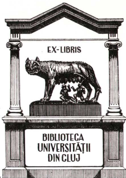
Ex librisek Gábor Dénes, a Művelődés című kolozsvári folyóirat felelős szerkesztőjének gyűjteményéből