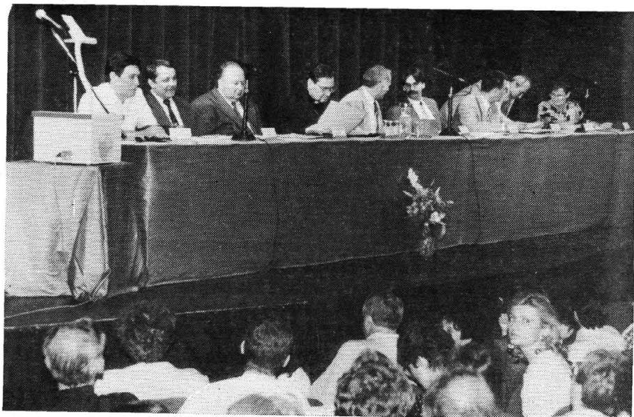
Kép az elnökségről