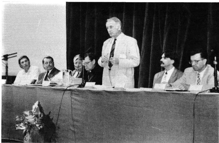
A plenáris ülés elnöksége