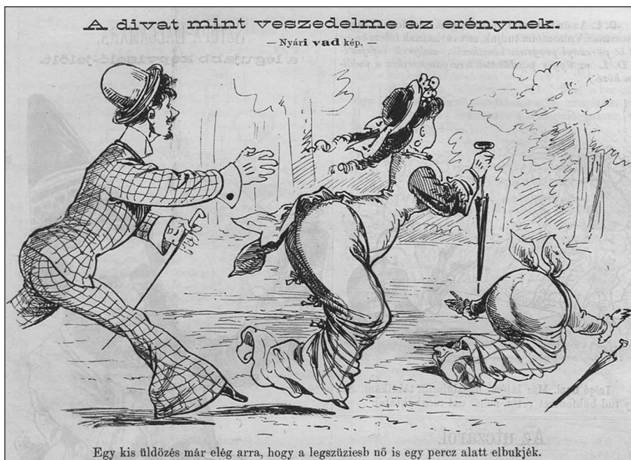
1. kép. A divat mint veszedelme az erénynek. Nyári vad kép. (Borsszem Jankó, 1875. június 13. 8. p.)