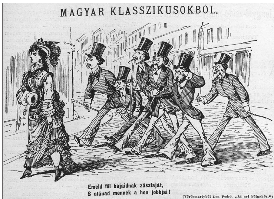
3. kép. Magyar klasszikusokból (Üstökös, 1876. november 26. 571. p.)