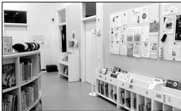
Gyermekkönyvek, játékok, szülőknek szóló szakirodalom, egészségügyi és szabadidős hirdetmények