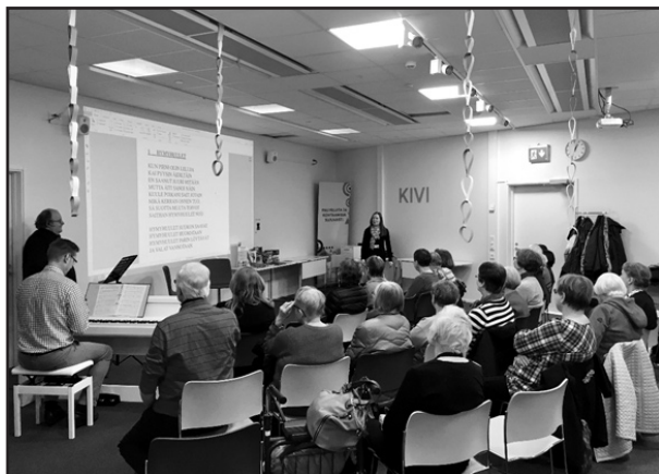
Az énekes produkciók népszerűek az idősek körében. Éppen az 1960-as évek dalait éneklük

A Koilliskeskus titka, szolgáltatásainak ereje és naprakészsége abban áll, hogy elhivatott és innovatív multiprofessionális team dolgozik benne: könyvtárosok, ifjúságsegítők, szülész-nőgyógyász és gyermekorvosok, védőnők, nővérkéik, valamint egy regionális koordinátor. A stáb hetente egyszer harminc perces megbeszéléseket tart, a gyors napi kommunikációt pedig a WhatsApp alkalmazással oldják meg. A marketing munkát egy könyvtáros és ifjúsági munkás team tartja kézben. Egy közös irodahelyiség áll rendelkezésre, ahol mindent egy helyen lehet intézni, ez segíti a feladatmegosztást és a másik szakmát űző kollégák napi munkájának a megismerését, összehangolását. Mindez hozzáad az integrált szolgáltatási modell sikeréhez, hiszen a fiatal intézményt máris havonta több ezer használó látogatta. Talán valóban ezé a modellé a jövő.