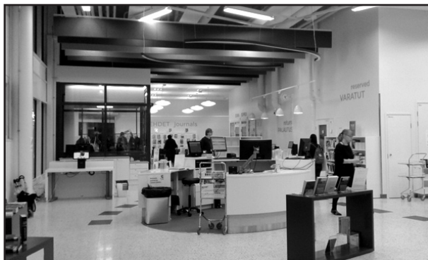
A főbejárattól balra étterem, kávézó és boltok, szemben folyóiratolvasó, jobbra olvasószolgálat és szabadpolcok, mellette védőnői szolgálat és ifjúsági tér.

A Koilliskeskus Tampere északkeleti területének jóléti központja, amely 2016. szeptember 12-én nyitotta meg kapuit. A területi jóléti központok részét képezik Tampere város új szolgáltatási modelljének. Ezen új modell szerint a szolgáltatásokat a város, az üzleti szektor, a civil szervezetek és a helyi lakosok közösen nyújtják. A Koilliskeskus egy ún. Prisma épületben helyezkedik el. A Prisma egy hatalmas, családbarát hipermarketlánc, amely többnyire sok apró boltot foglal magában a gyógyszertártól, az állateledelt, alkoholt és fotókellékeket árusító üzletektől az étteremig és kávézóig.