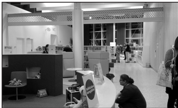
A védőnői szolgálat és az olvasó- és játszósarok mellett magas háttámlás szoptatós fotelek. A hátsó bal sarokból nyílik az ifjúsági térbe vezető lépcső

A könyvtár programjai kialakításakor különös figyelmet szentel a helyi kisgyermekes családoknak, a fiataloknak és az időseknek. Van rendszeres történetmesélés gyermekeknek, vannak író-olvasó találkozók, zenés-táncos rendezvények, informatikai és könyvtárhasználati foglalkozások iskolásoknak, az ifjúsági központban dolgozó ifjúságsegítők pedig ifjúsági összejöveteleket, kézműves foglalkozásokat és más elfoglaltságokat szerveznek párfogoltjaiknak a téli szünetre.