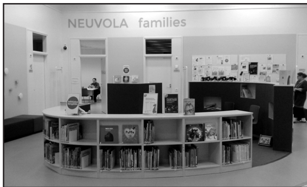
A védőnőre várakozva az egész család talál lapozgatni és kölcsönözni valót, játékot