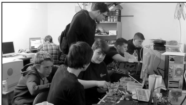
Internet Fiesta a Mikrokontroller Klub tagjainál, 2017

Az Országos Könyvtári Napokhoz pedig már tizenegyedik éve csatlakozott intézményünk. A Faluház Mikrokontroller klubja ennek során is több esetben bemutatkozott, a 3D nyomtatás mindig vonzza az érdeklődőket. A klubtagok autonóm robot bemutatót tartottak, melyeket saját maguk készítettek és programoztak. 2017-ben a gödöllői könyvtár is meghívta az OKN-programja keretében a csoportot egy egész napos bemutatóra. A különböző, faluházban rendszeresen működő csoportjaink programjait is regisztráltuk az OKN napokra.