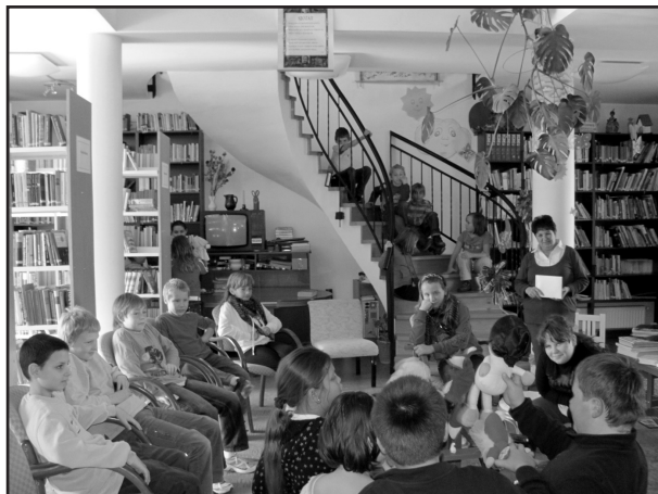
Könyvtári óra bábózással

2017-ben a beiratkozott olvasók száma 313 fő, ebből 124 fő 14 év alatti, 136 fő 14 – 65 év közötti, 53 fő 65 év feletti. Új beiratkozó: 62 fő. Könyvtárközi kérésünk 12 db dokumentum volt, ebből 11 db-ot tudunk olvasóink rendelkezésére bocsájtani.