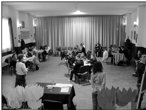
Petőfi a Galga-mentén vetélkedő