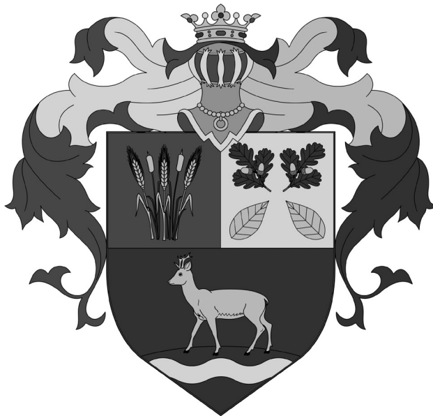
Dóc község címere