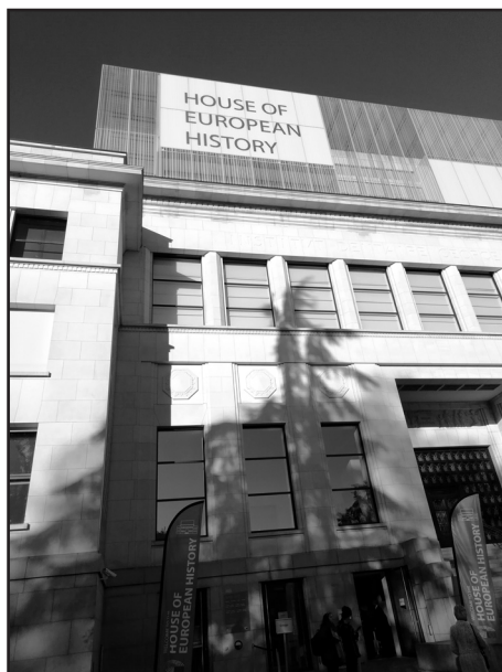
Az Európai Történelem Háza

„Az Európai Történelem Háza a Léopold parkban álló, gyönyörűen felújított Eastman épületben található. Kiállításai az Európai Unió mind a 24 hivatalos nyelvén elérhetők, és a belépés díjtalan. Egyedileg kialakított segédanyagok állnak az iskolák, családok és csoportok rendelkezésére, lenyűgöző élményt nyújtva mindenki számára.” 22