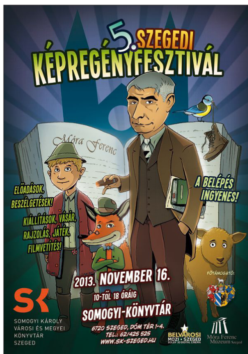
A fesztiválplakátra 2013-ban Móra Ferenc is felkerült

A következő években arra törekedtünk, hogy minél jobban kiaknázzuk azokat a lehetőségeket, amelyek a Somogyi-könyvtár Szegeden betöltött meghatározó kulturális szerepéből és a több évtizedes kapcsolatrendszeréből fakadnak. Ismét új utakat keresve, társintézményekkel közös projektekben gondolkoztunk. 2012-ben a Szegedi Nemzeti Színházzal dolgoztunk együtt, egy akkori ősbemutatóhoz kapcsolódó tematikában gondolkoztunk, képregényrajzoló partnereink ezért a Pipás Pista című darabhoz készítettek illusztrációkat, és plakátok is készültek. A rá következő évben a Móra Ferenc Múzeummal dolgoztunk együtt, a Móra-emlékévhöz kapcsolódóan, 2015-ben pedig nekünk is sikerült felülnünk a Star Wars-vonatra, így az egész eseményt eköré a téma köré szerveztük.