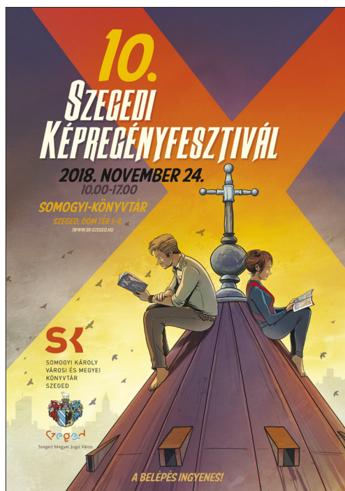
A szegedi dóm eltérő módon, de minden fesztiválplakáton látható