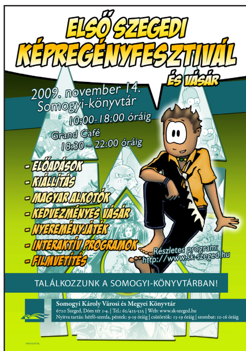
Az első Szegedi Képregényfesztivál és Vásár plakátja – 2009