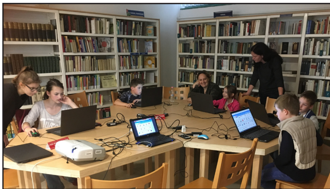
Örömmel kódolnak a gyerekek a kispesti könyvtárban

Néhány hónappal később – 2018 áprilisában – már meg is nyithattuk az új klubszobát, ahol azóta minden kisebb programot meg tudunk tartani. 2018 októberében elindult a Scratch-klub. Egyelőre egy külföldön már bevált módszert, a BYOD – Bring Your Own Device (hozd a saját eszközöd) metódust választottuk a programhoz, mindenki hozhatta a saját laptopját, a könyvtár pedig biztosította az internetet a Scratch-oldal eléréséhez. Így is lelkesen jöttek az érdeklődők, a programozó diákok.