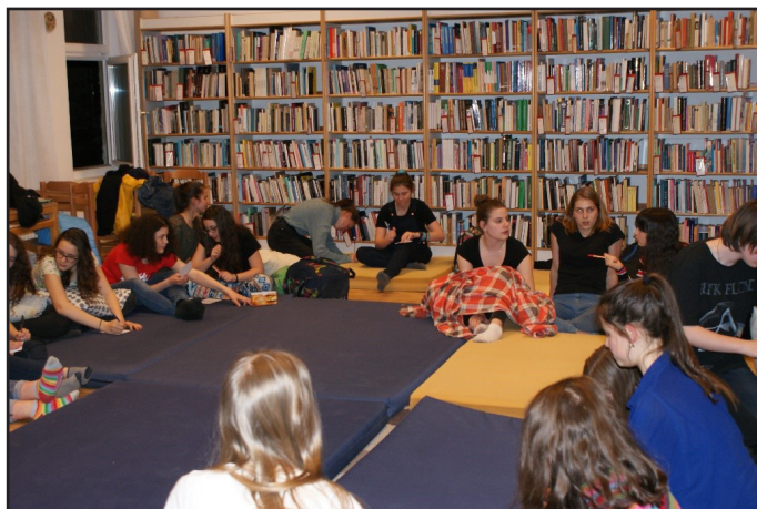
Ismerkedés, kötetlen beszélgetés az olvasásról

Frappáns, versengő, szellemes ajánlások ezek a diákok szájából. Az este egyik legizgalmasabb percei azok, amikor titkos szavazással döntenek a jelenlévők arról, hogy melyik könyv legyen az, amelyet a társaság egész éjjel hangos, közös olvasással megismer. Sokszor egy-egy merész és eredeti gondolat vagy a diák személyiségére gyakorolt hatás részletezése az, ami ráveszi a szavazókat arra, hogy az adott könyv mellett tegyék le a voksot.