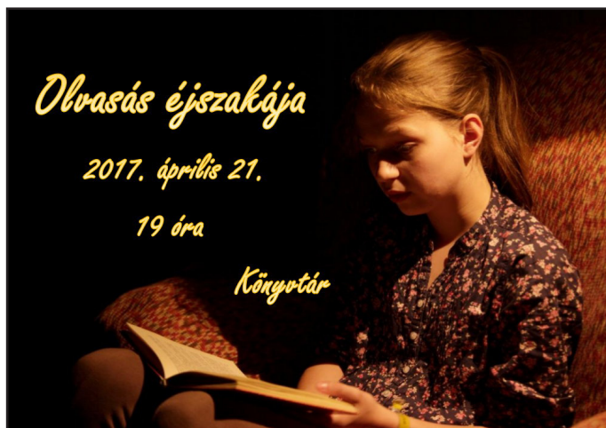
A 2017-es Olvasás Éjszakája plakátja

A fiúk éjszakai focijának hangos és töretlenül sikeres programja feszélyezően hatott ránk. Sokkal könnyebben lehet mozgósítani egy sokak által űzött sporteseményre, mint az elmélyülést igénylő olvasásra. Másfajta erőfeszítés, egészen más törzsközönség. Ha egy osztályban megkérdezzük, hogy hányan kedvelik a focit, akkor 50%-os pozitív visszajelzésre számíthatunk. Az olvasás kérdésében folytatott tudakozódás osztályonként 4-5 diák lelkesedését állapíthatja meg. A másik nehézséget az okozza, hogy azok a tanulók, akik nagyon szeretnek olvasni, általában nem kedvelik a nagy és hangos programokat. Csendesebbek, visszahúzódnobbak azok, akik szövetséget kötöttek a könyvekkel.