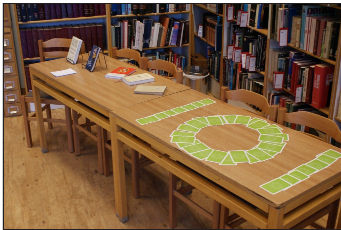
Az ismerkedő kör kellékei

Ölelkezés, sikítózás, vinnyogás és öröm a könyvtár minden szegletében! Izgalmas péntek este visszajönni a suliba, amikor már lement a nap, és minden tanár az otthonában van. Egyértelmű: az iskola a miénk! E két rövid mondattal summázhatom azokat a perceket, amelyeknek a hangulata valósággal felpezsdíti a levegőt ilyenkor. Minden évben vannak tapasztalt diákok, akik ismerik az éjszaka jól bejártott szokásait. Ők szokták elmondani az újoncoknak, hogy milyen rend szerint zajlik a program. Ezután a bevezető, eligazító ismertető után következik az ismerkedő kör. Az előzetes beszélgetést idén a Boldogító erősségek nevű kártyajáték segítségével bonyolítottuk le. A könyvtári asztalon elhelyezett pozitív gondolatokat tartalmazó kártyák közül ki kellett választani azt az egyet, amelyik legjobban jellemzi a tanulót.