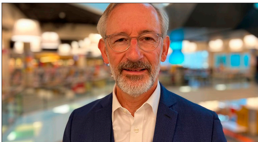
Theo Kemperman

Hangsúlyos kérdés, hogy a könyvtárnak úgynevezett harmadik helyként milyen vetélytársakkal kell megküzdenie, és a közösségi funkciót milyen partnerkapcsolatok mentén tudja ellátni. Theo Kemperman szerint a közkönyvtárak vitális fizikai találkozási helyek a társadalomban. A könyvtári terek azonban nem csupán az olvasók számára hasznosak, a környéken elérhető partnerek is felhasználhatják azokat, így kölcsönösen mindenki számára hasznos szolgáltatást képeznek. Az olyan vetélytársakkal szemben, mint a színházak és a múzeumok, azért élvez jelentős elsőbbséget a könyvtár, mert ez az egyetlen közintézmény, amely valóban mindenki számára egyformán elérhető.