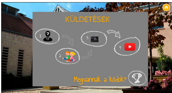
Feladatok az online szabadulószoobában

A felület sok lehetőséget nyújt az interaktivitásra, szabad navigációt enged a létrehozott lapok között, beágyazhatunk különböző videókat, linkeket, vagy akár LearningApps játékokat is. Jelszóval védett oldalakat adhatunk meg, és létrehozhatunk a játék során mozgatható vagy láthatatlan elemeket is. Szerkesztés közben a kijelölt objektumok tulajdonságait (pl. szín, pozíció, átlátszóság, árnyék) a szokásos menüsoron módosíthatjuk és különböző animációkat (pl. megjelenés, nagyítás, pörgés, eltűnés) adhatunk hozzájuk. A mi online szabadulószoobánk is egy már meglévő sablonra épül.