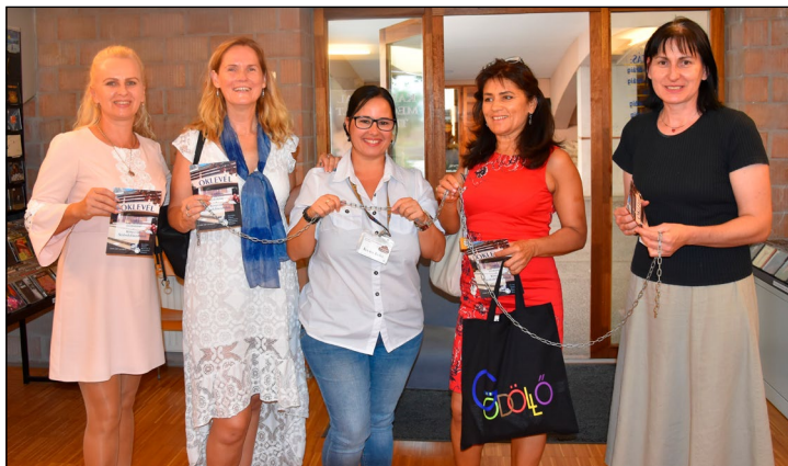
A kiszabadított könyvtáros, 2021

a szakmai nap végén. A szabadulósobát könyvtári óraként a foglalkozásajánlónkban is meghirdettük, de még nem volt lehetőségünk így megvalósítani.