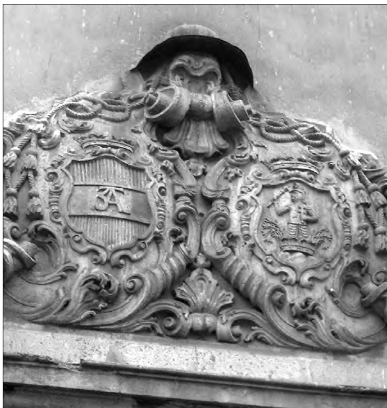
Miskolc, az alsóvárosi templom kapubejárata