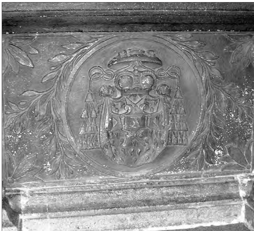
Nógrádverőce, Mária-oltár (a szerző felvétele)