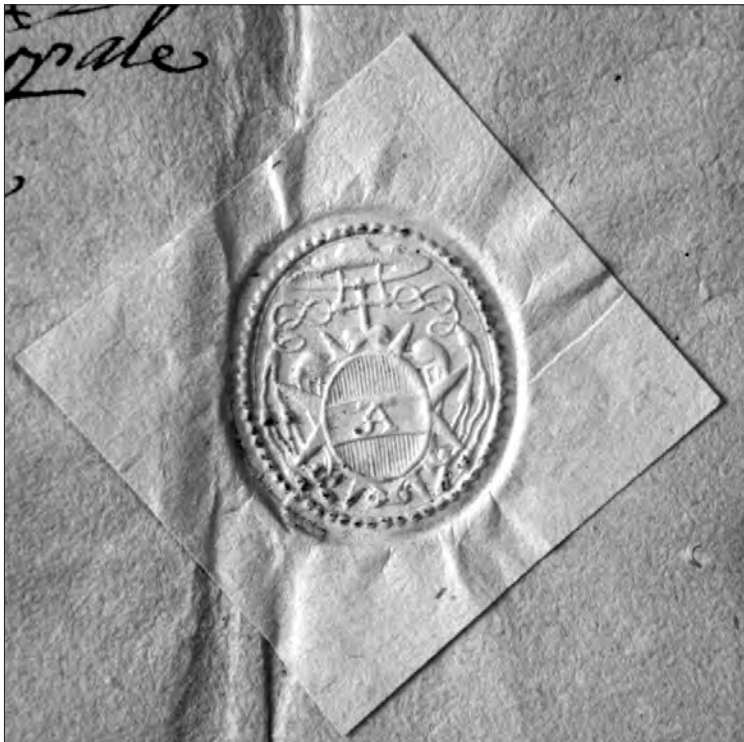
Pecsétgyűrű lenyomata 1731-es iraton

Ovális pajzsban rovátkolva színjelzett Althann-címer. Körülötte kissé stilizált – heraldikai tartalom nélküli – barokk kartus díszítés. A címer alatt a Máltai Lovagrend keresztje, a felső keresztzár közepén kereszttel. Az egész címer felett, címerfedélként bíborosi kalap, oldalain egy-egy hurokkal és tíz-tíz lelógó bojtjal. Ez utóbbiak némiképp befelé