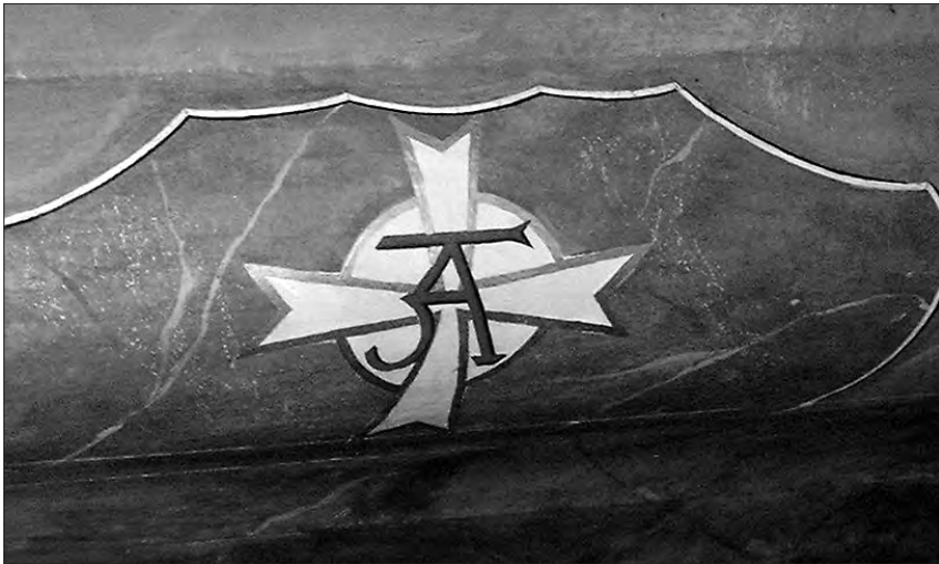
Nógrádverőce, főoltár, oltár-stipes

lyű, fehér máltai kereszt közepén vörös A betűvel. A festett kereszt mérete 26 x 26 cm, a kör átmérője 13 cm, az A betű 10 x 10 cm.