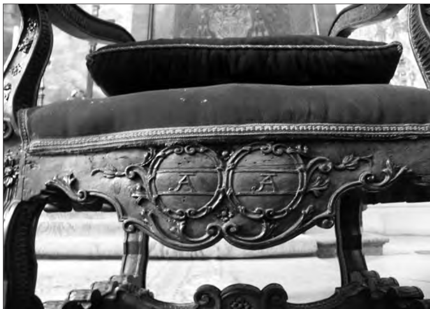
Vác, püspöki trónszék