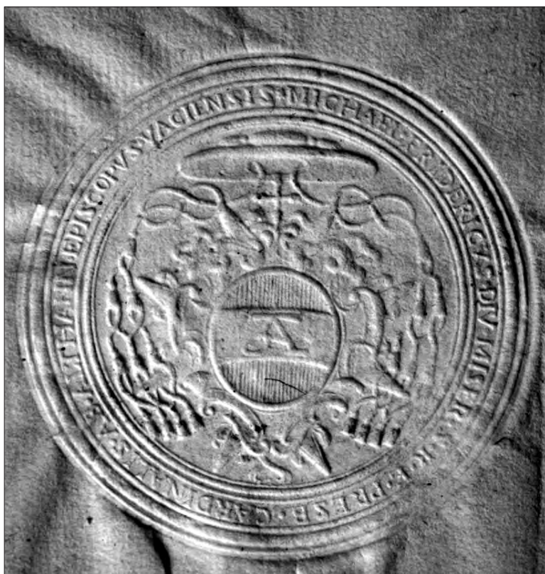
Ostyapecsét 1729-es iraton

Nagyméretű, ovális pajzsban rovátkolva színjelzett Althann-címer. A pajzsfőben, a pajzstalp alatt, a pajzs jobb és bal szélein stilizált – heraldikai tartalom nélküli – kartus díszítés. Az egész címer palástra van