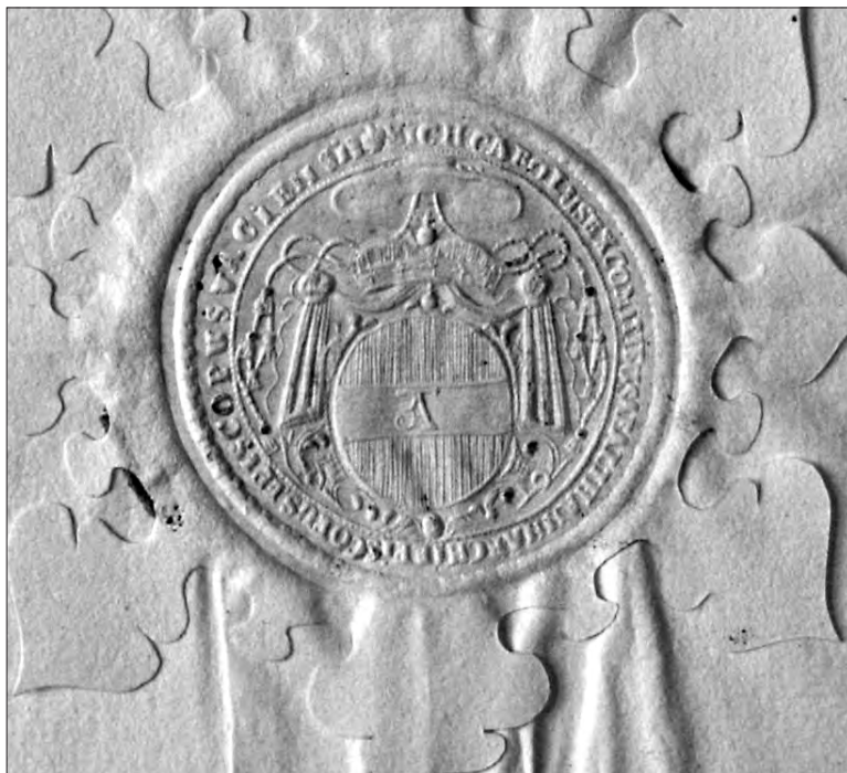
Tipárium lenyomata 1736-os iraton

2. A püspökhatvani (Pest megye) római katolikus (Szent Lőrinc vértanú) templomot gróf Althann Mihály Károly püspök emeltette 1736-ban. Az egyenes felső záródású, szalagkeretes, záróköves bejárat felső része és a szemöldök alatti mezőben látható címere. 21 Az egyszerűbb