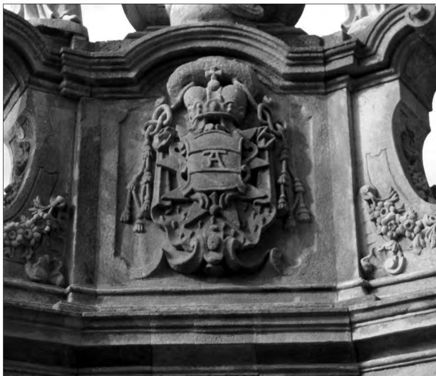
Vác, Szentháromság-szobor