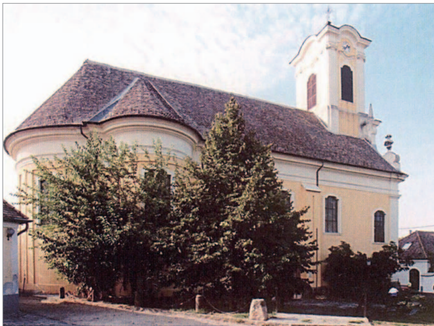
9. kép. ÉSZAKI OLDAL. ČIPROVAČKA-TEMPLOM. Szentendre, 1792

A fentiekből kiviláglik a magyarországi szerb templomépítkezéseket jellemző két fő tendencia. A többségi környezet részéről az építkezések hivatalos engedélyezése egyrészt, más-