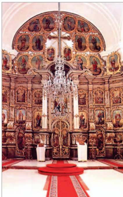
5. kép. SZOLEA. BEOGRADSKA-TEPLOM. Szentendre, 1764

Ezek az általános keleti keresztény sajátosságokon túl a szerbek templomai olyan elemekkel is rendelkeznek, amelyek a görög és a román templomoknak nem sajátjai. Ilyen a homlokzati torony nyitott alsó szakasza, a külső előcsarnok, az exonarthex (Szentendre Preobraženska-templom, Majs stb., 6. kép). Előfordult, hogy a későbbiekben az exonarthexek északi és déli nyílását befalzták (Beremenden, Dunaszekcsőn, Siklóson stb.).