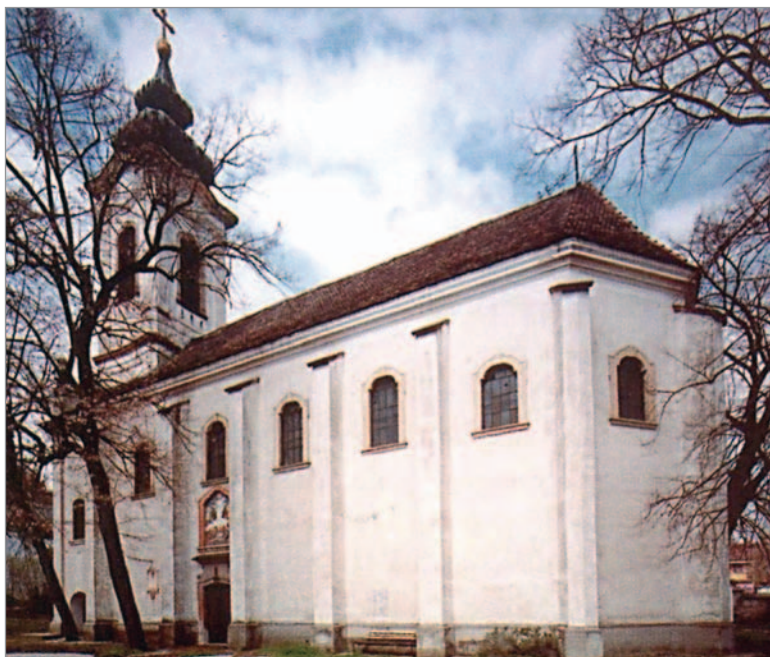
1. kép. SZENTÉLY ÉS DÉLI OLDAL. PREOBRAŽENSKA-TEPLOM. Szentendre, 1741

Ezekben az években nem csak a fatemplomokat építik át, hanem a régebb óta fennálló kőtemplomok is „barokkos fölfrissítést” kapnak: a bánáti monostorok közül a hódos-bodrogi barokk homlokzatot, a mesiçi harangtoronyt kap. Barokkos köntösbe öltöznek a fruska gorai monostorok is, a krusedoli monostor temploma például barokk kapuzattal, a jazaki és a beočini monostortemplomok barokk harangtoronnyal egészülnek ki.