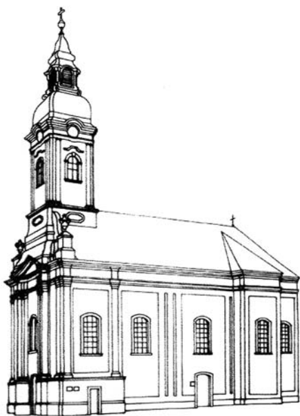
10. kép. ÉSZAKI OLDAL. SZENT MIKLÓS TEMPLOMA. Szeged, 1778

Azt látjuk, hogy az építtetők az idegen architektúrába elsősorban azokat az óhazai elemeket vitték be, amelyek a templom igényeik szerinti működtetéséhez, keleti liturgia tartásához, a vallás gyakorlásához elengedhetetlenek voltak. Az óhazai vallás gyakorlása a szerbek számára nemzeti önazonosságuk megtartását segítette elő. A 18. században emelt napkeleti istenházak tehát még nyugatias megjelenésükben is hosszú időn keresztül szolgálták-szolgálják az építtető kisebbség nemzeti létében való fennmaradását.