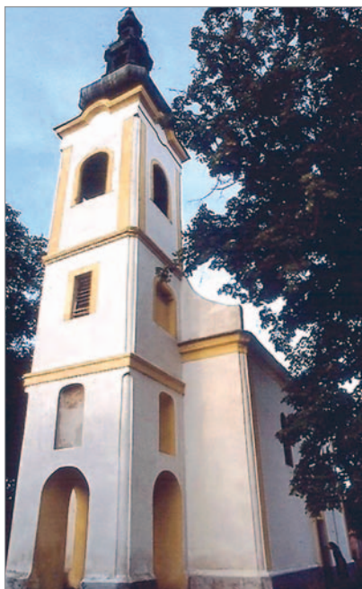
6. kép. EXONARTHEX. SZENT PARASZKEVA-TEPLOM. Majs, 1781