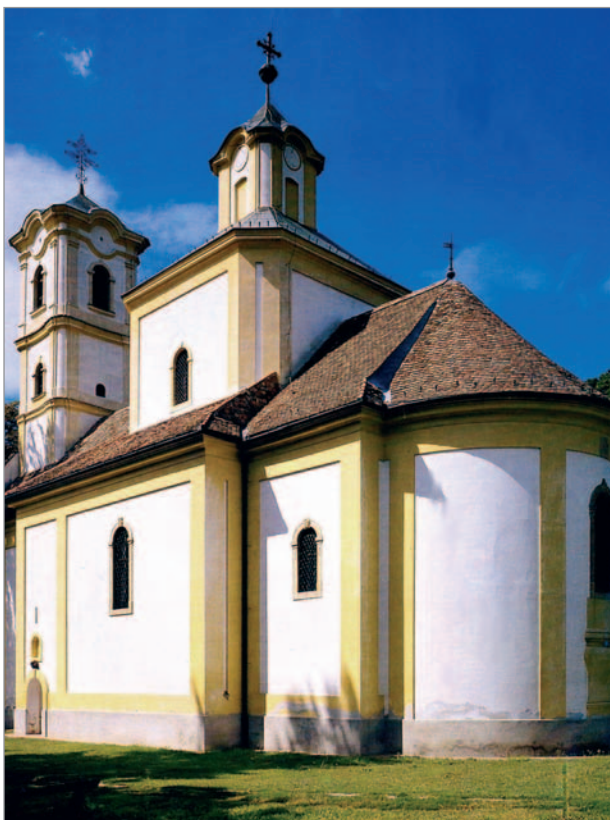
3. kép. SZENTÉLY ÉS DÉLI OLDAL. SZENT MIHÁLY ARKANGYAL TEMPLOMA. Grábóc, 1741

menje engedélyt kapott a bécsi udvartól a régi templom felújítására. 29 Az engedély birtokában azonban a közösség nem templomfelújításba fogott, hanem új templom építését kezdte el oly módon, hogy a liturgikusan még funkcionáló korábbi templom köré kezdte építeni az újat. A közösség 1738-ban a régi templomot elbontatta, az újat pedig – torony nélkül – 1741-re föl is építette. 30