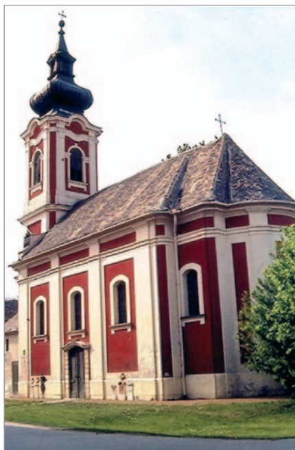
7. kép. APSZIS. ISTEN ANYJA SZÜLETÉSE-TEPLOM. Hódmezővásárhely, 1786

Szerb templomokon figyelhető meg a szentély falának külső hármás, szögletes záródású tagolása is (például Hódmezővásárhelyen, 7. kép), ami a háromkaréjos szentélyzáródás utánzása, és sajátja a moravai építészetnek is (például a grábóci szentélyfal tagozódása). Ezek a karéjok rejtették a prothezist (az északi) és a diakonikont (a déli).