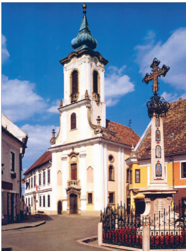
2. kép. HOMLOKZAT. BLAGOVEŠTENSKA-TEMPLOM. Szentendre, 1754. Mayerhoffér András

zékori szerb hagyományokat követő bizáncias megjelenésű kupolás épület. 26 Ezen a helyen 1587-ben már állott egy kőtemplom, melyet a dalmáciai Dragovič-monostorból idetelepült szerzetesek emeltek 27 a korábbi fatemplom helyén, a budai pasa engedélyével. 28 Az évszázadok során a monostortemplomot többször lerombolták, majd újjáépítették. 1736. február 1-jén Makszim, a monostor igu-