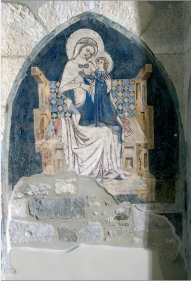
1. kép. TRÓNOLÓ MADONNA, freskó, 1330 körül, Budapest, Belvárosi főplébánia-templom

a felület festése az évszázadok során megkopott. A kép kompozíciója és művészi megjelenítése kiemelkedő művész alkotására vall. Ezt jelzi a mély érzelmi kifejezés, a kiegyensúlyozott képszerkezet, a kiemelkedően biztos rajzkészség, amely a kép egészének és az egyes részleteknek is sodró erejű expresszivitást kölcsönöz. Ilyen remekműví részlet az anya és a gyermek kezének ábrázolása és a két-két kéz együttesének kítűnő kompozíciója (2. kép).