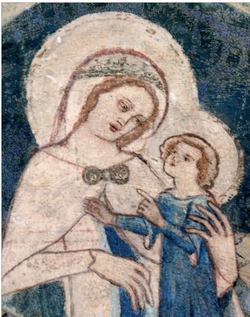
2. kép. Az első kép részlete

más felé forduló ábrázolása – a ferences és a domonkos lelkiség nyomán, a XIII. századi francia gótikus művészet ösztönzésére – a XIII. század végi és XIV. század eleji gótikus művészet fontos jellemzője. Az itáliai képzőművészetben Giovanni Pisano († 1319) szobrain, Duccio († 1319) és műhelye képein jelentkezett először. Az itáliai trecento festészetben Simone Martini (1284–1344) és a Lorenzetti fi-