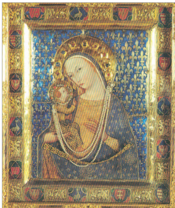
3. kép. A MARIAZELLI KEGYKÉP, 1350-es évek, Nagy Lajos király ajándéka

Mindkét in situ freskóképnek, a művészeti értékük mellett, a templom építéstörténetére vonatkozóan is nagy jelentősége van. Igazolják, hogy a templom szentélye már a XIII. században is a maival azonos méretű volt! A templom alapterülete, a maihoz hasonlóan, 55×30 méter volt. A háromhajós, két homlokzati tornyos gótikus bazilika