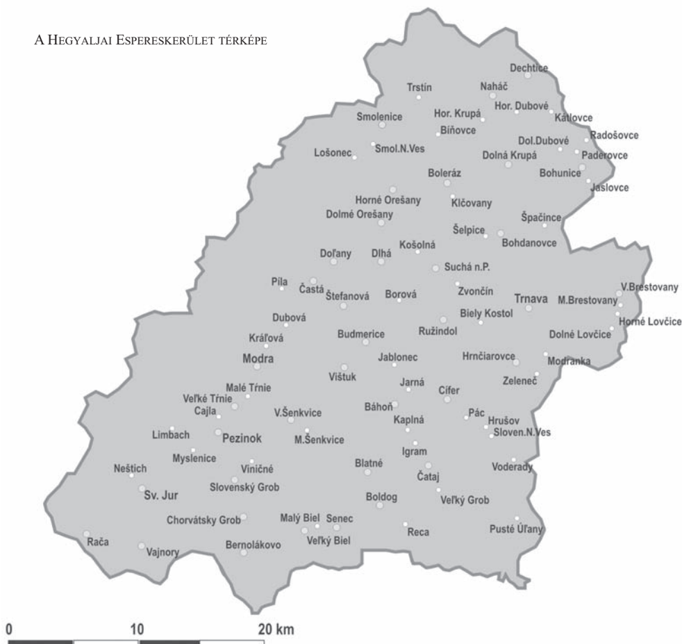
A HEGYALJAI ESPERESKERÜLET TÉRKÉPE

Az új rekatolizációs törekvések más jellegűek voltak, mint Oláh Miklós és Pázmány Péter idejében. Egyre inkább az uralkodó világi hatalmára támaszkodtak, nem pedig saját újító tevékenységükre. A hatalmi körök kizárták a vallási kérdéseket az országgyűlés üléseinek programjából, és országos rendeletekben döntöttek róluk. 35