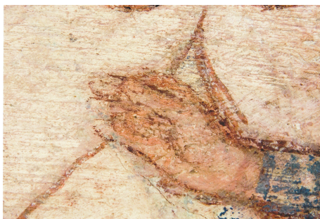
A GYERMEK JOBB KEZÉNEK KÉPE

ve azon keresztül az átlényegülésre történő utalás vélhető szándéka. A bal kéz figyelmeztető mozdulattal felemelt mutatóujja a kép mondanivalóját hangsúlyozza. 7