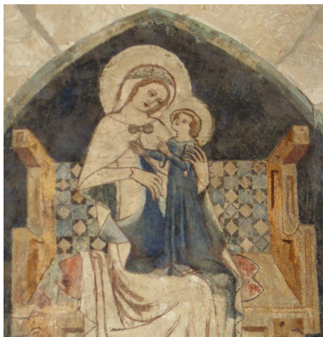
A BUDAPEST-BELVÁROSI FŐTEMPLOM GÓTIKUS FALKÉPE

A kölni ágostonrendi fehér apácák Mária Magdolna kolostorát Napóleon 1808. november 23-i rendelete szüntette meg. 1809-ben lebontották a temp-