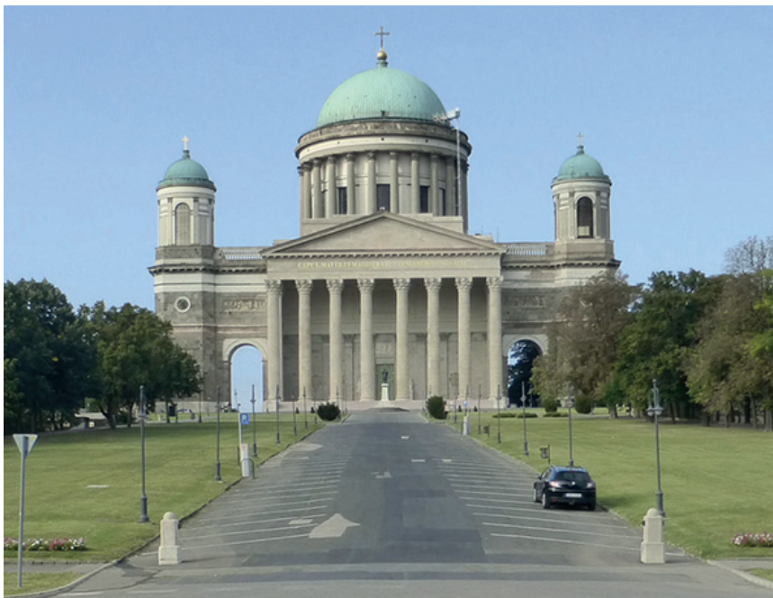
2. kép. A FŐSZÉKESEGYHÁZ ÉS ELŐTTE A FELHAJTÓ (2020. szeptember)

válik meghatározóvá. Aminek legfeljebb a belső szélén, az aszfaltút mentén fut előbb a sövény mellett rózsaaágys, 14 később már csak ez utóbbi. 15 Végül a Sötétkapu és az azt övező pincerendszer fölött az utóbbi években kialakított egységes füves zöldfelület (az örökzöldek kivágásával) teremtett kedvező feltételeket a Hild József terveit tükröző klasszicista homlokzati struktúra látványának kibontakoztatásához (2. kép).