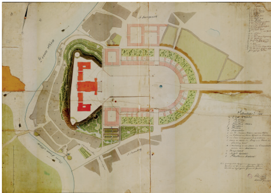
4. kép. KÜHNEL PÁL III. KONCEPCIÓJÁNAK HELYSZÍNRAJZA (PL, TGy 74)