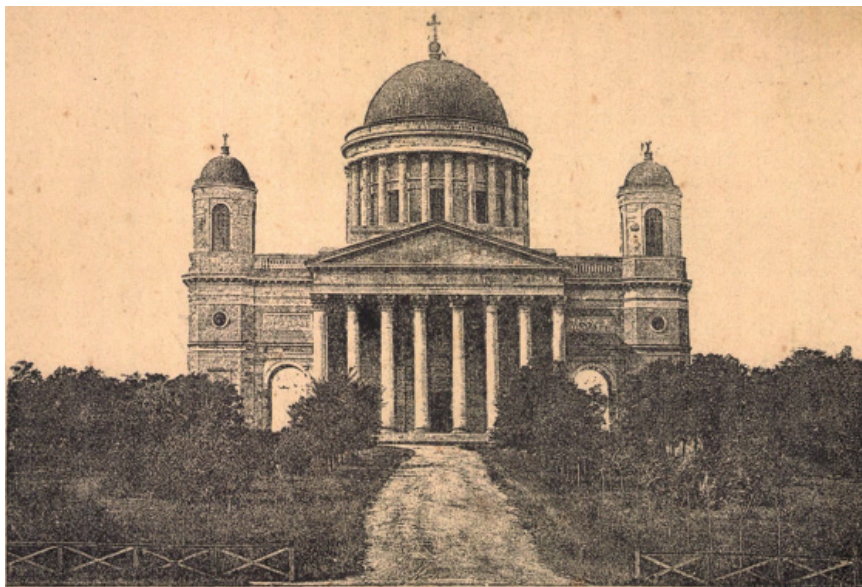
1. kép. A BAZILIKA FŐHOMLOKZATA GYÖRFFY LAJOS KÖNYVÉBEN 1886 KÖRÜL

A II. világháború után, az 1950-es években 12 eleinte még továbbra is alacsony cserjét találunk a rámpán, de az 1960–70-es évekre 13 már a füvesítés