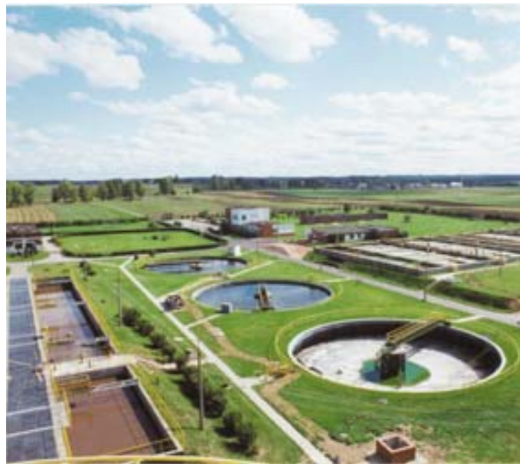
Suwalki: ISPA-forrásból finanszírozott szennyvíztisztító telep.