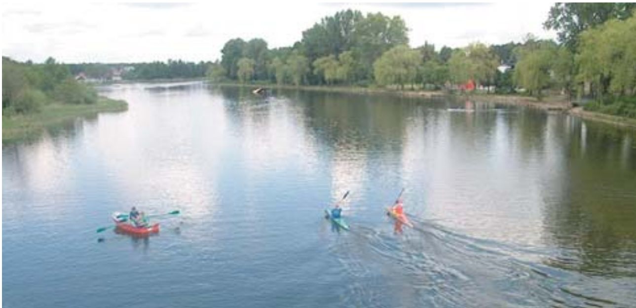
Tavak és folyók földje.

ISPA, PHARE, SAPARD... Podlaskie északi része már évek óta részesül olyan közösségi programokból, amelyek hozzájárulnak az infrastruktúra, a környezetvédelem, a vállalkozások versenyképességének fejlesztéséhez és az új Unió keleti határánál elhelyezkedő régióban élő lakosok életminőségének javításához. Mindez a közösségi játékszabályok szereplőinek és döntéshozóinak kezdeményezésére jött létre.