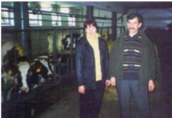
SAPARD-kedvezményezettek: a farmtól a tejfeldolgozóig.

A PHARE 2 segítségével az augustow-i önkormányzat ambíciózus (7 millió eurós, ebből 4,2 millió eurós közösségi támogatású) városi újjáélesztési és a csatorna körüli idegenforgalmi fejlesztési programba fogott. A helyi hatóságok az idegenforgalmat a város alapvető fejlődési irányának tekintik; 1993 óta 4000 ágyas – évente 100 000 látogatót fogadó – termálfürdővel rendelkezik. „Célunk az idény meghosszabbítása, amely még mindig túlságosan július és augusztus köré összpontosul. Még több külföldi turistát szeretnénk fogadni,