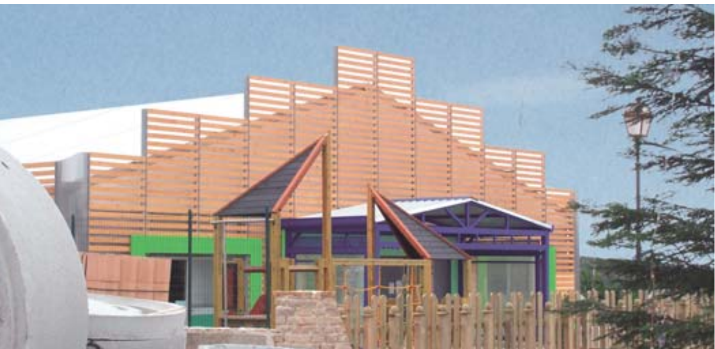
Az EUSZA által finanszírozott ideiglenes iskolai épület San Giuliano di Puglia (Olaszország) katasztrófa sújtotta lakosai számára