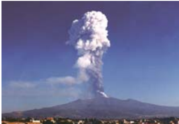
Olaszország: az Etna kitörés közben 2002 őszén

A kérelmek vizsgálata azt bizonyította, hogy a rendelet néhány alapvető fogalmát értelmezni kellett ahhoz, hogy a gyakorlatban alkalmazható legyen. A 2004-ben közzétett jelentésben (5) a Bizottság számba veszi a különféle tapasztalt problémákat, és részletes módszert dolgoz ki a kérelmek egyenlő és következetes elbírálására.