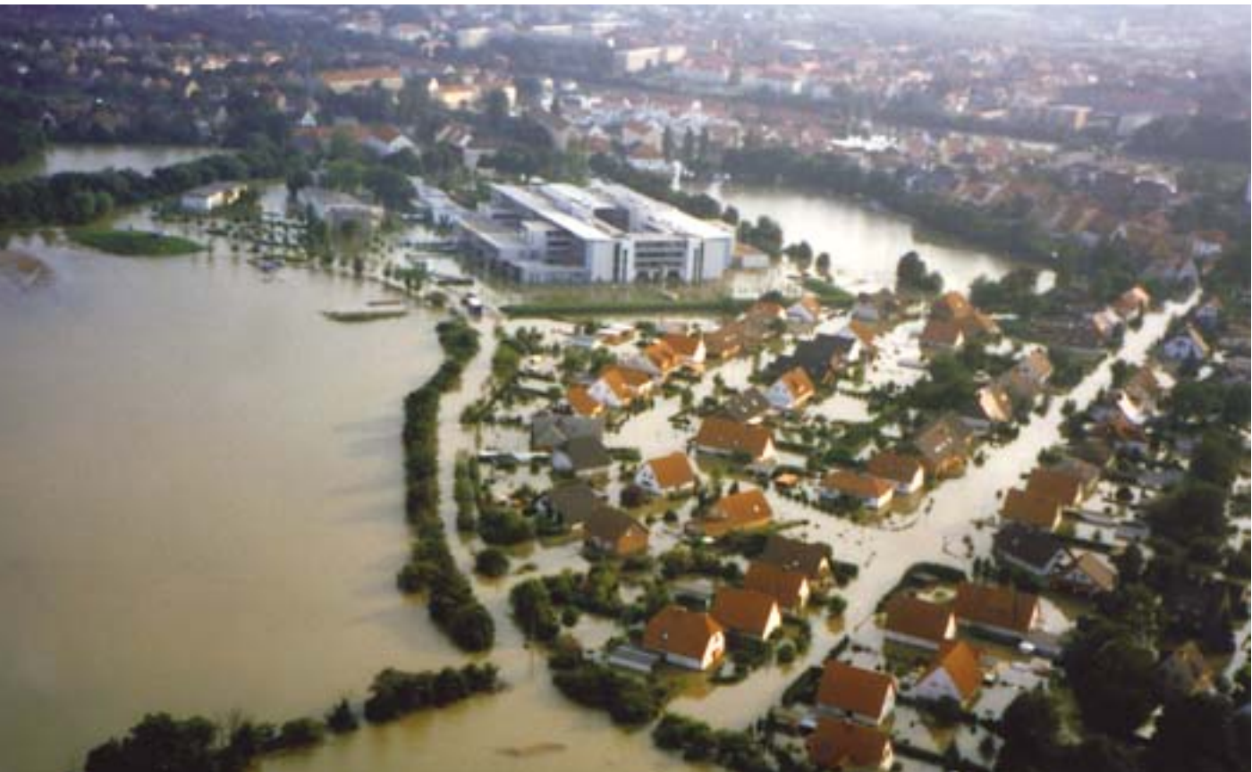
Németország, 2002. nyár: amikor az Elba kilép a medréből...

A Tanács azonnal megkezdte a javaslat vizsgálatát, amely két fontos célt fejezett ki: az új pénzügyi eszköz elfogadására és gyors megvalósítására irányuló akaratot, valamint – mivel ez csak utolsó lehetőségként használható fel – azt a törekvést, hogy garanciákat léptessenek életbe a gyakori felhasználás elkerülése érdekében. Ennek következtében a Bizottság javaslata néhány pontban meglehetősen kemény lett.