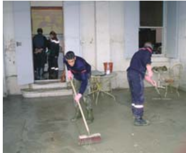
Franciaország: tisztítási művelet a Rhône 2003. decemberi áradása után

Ez a módszer lehetővé teszi évente több támogatás juttatását különböző súlyosságú és nem azonos gazdasági teljesítménnyel rendelkező országokat érintő katasztrófák esetén. A támogatás mértéke emellett fokozottabb a nagy katasztrófák esetében, mint a kisebbeknél, és az érintett ország azzal kapcsolatos kapacitásától függően változik, hogy mennyire képes saját erejéből megbirkózni a helyzettel.