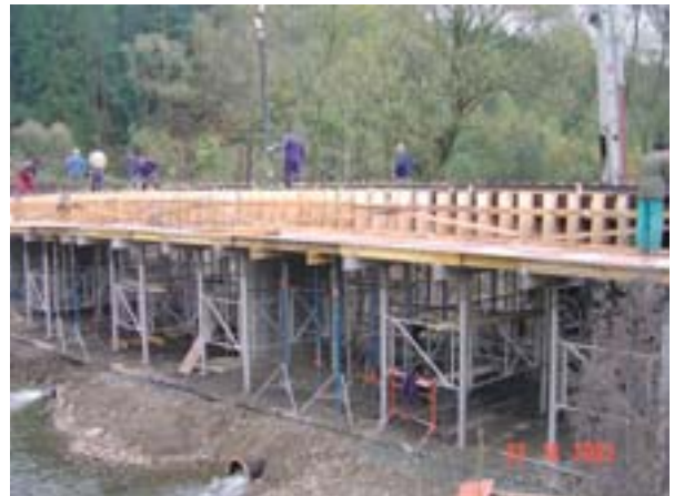
Híd helyreállítása a pilseni régióban (Cseh Köztársaság)

Minden feltételnek teljesülnie kell ahhoz, hogy a katasztrófát „rendkívülinek” lehessen minősíteni, mivel az mind jellegében, mind az okozott kár mértékében, mind az érintett régióra gyakorolt hatásában meghaladja az ésszerűen várható mértéket. 2002 decembere és 2004 szeptembere között a Bizottság csak hat kérelemről ítélte úgy, hogy teljesíti ezeket a feltételeket, és javasolta így az Alap mozgósítását. Négy másik esetben elutasító döntés született.