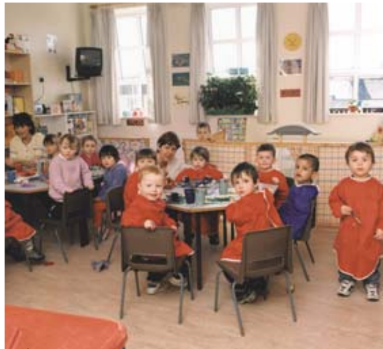
A mullingari napközi otthonon néhány kis „lakója”

(1985–87), titkársági, könyvelési és informatikai tanfolyamokkal folytatva (1997-től), egészen a bevándorló asszonyok angol nyelvvel való megtanításáig (2002-től) terjednek.