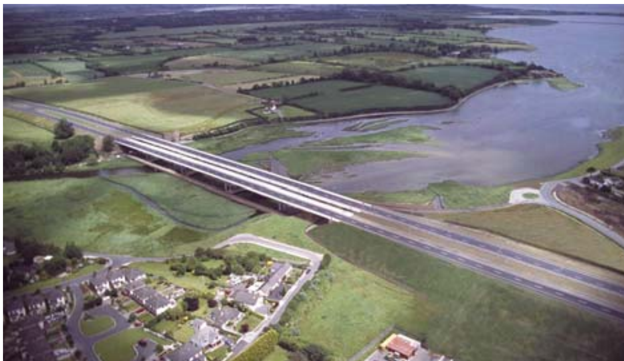
Az M1-es autópálya elérte a Broadmeadow torkolatát

Az európai támogatások által teremtett lehetőségek legmegfelelőbb felhasználásával harminc év után az Unió egyik legvirágzóbb tagállamává lépett elő az az ország, amelyet 1973-as belépése pillanatában még az Európai Közösség legszegényebb tagjának tartottak. De mi hozta annyira lendületbe az íreket? Milyen „tippeket” adhatnak az új tagországoknak? Válogatás a legjobb gyakorlatokból.