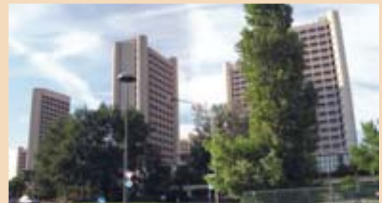
Emilia-Romagna régió bolognai székhelye

kezd, amely eléggé érzéketlen volt az együttműködés által szolgáltatott hozzáadott értékre, és mind jobban elterjed az a felfogás, amely a nemzetközi kapcsolatokban a növekedési lehetőségek kibontakozását látja. Ebből a szempontból aláhúzó az a tény is, hogy a következő projektfelhívások számára készített új jelölti iratcsomó átnyújtásakor, majdnem minden partnerünk és az összes projektkoordinátor újabb felhívásokhoz jutott a megelőző javaslatokat illetően, habár ismertek az Interreg-programok irányításával járó, számottevő nehézségek. Ez pedig azt jelenti, hogy ezeknek a partnereknek is az a véleménye, hogy a nemzetközi együttműködés által szolgáltatott hozzáadott érték érdemessé teszi a nehézségek vállalását, és hogy elegendő tapasztalatra tettek szert ezen nehézségek ismételt vállalása érdekében.