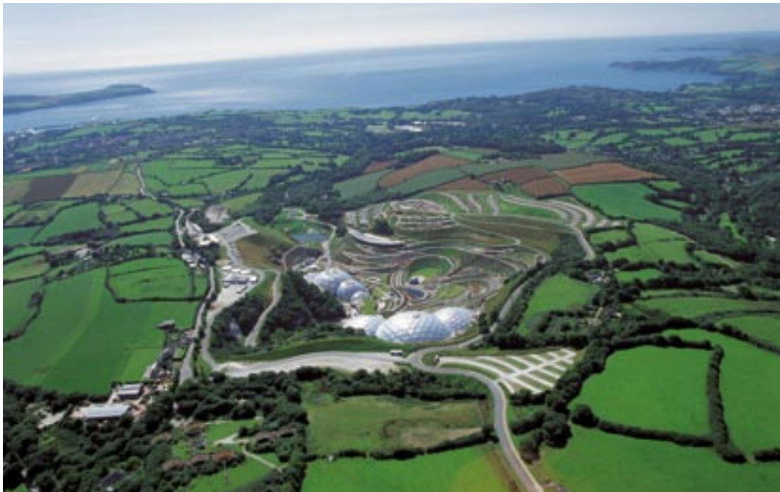
A St. Austell melletti Éden Projekt panoramikus látképe

Az 1. célkitűzésből 2000 és 2006 között részesülő és a konvergencia-célkitűzés 2007–2013-as finanszírozására jogosult cornwalli régió és a Scilly-szigetek valóságos szociális-gazdasági fellendülésen mennek keresztül. A válsággal küszködő és főleg az elsődleges erőforrásaira és a turizmusra építő vidéki régió, Anglia „Finistere”, a tudásalapú gazdaságra tér át, ezáltal is elismerve a nyitottság, a sokszínűség, az innováció és a minőség értékeit.