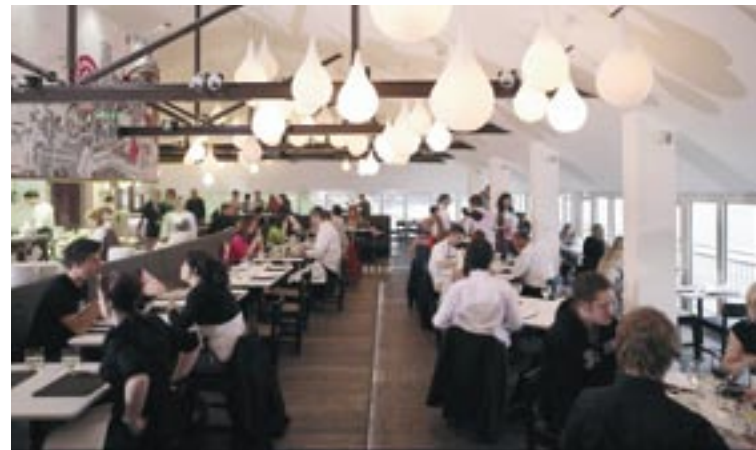
A vendégek élvezik a Fifteen első osztályú konyháját

Az 1. célkitűzés befektetési révén Cornwall és a Scilly-szigetek egy másik restrukturációs eszközhöz is hozzájutottak: a szélessávú internetes hozzáféréshez. „Biztosra vehető, hogy az egyetem mellett ez a regionális megújulás egyik legfontosabb eszköze – jelenti ki Ranulf Scarbrough, kutató informatikus, a Regionális Fejlesztési Ügynökség, a British Telecom plc, a cornwalli megyei tanács és más intézmények és szervezetek által 2002-ben az állami és a magánszektor között a szélessávú hozzáférés elősegítése érdekében létrehozott együttműködés, az »Actnow Broadband Cornwall« volt igazgatója. – Feladatunk a régió felének és 3300 vállalkozásnak ADSL-kapcsolattal való ellátása volt. Négy évvel később a régió 99%-a le volt fedve, és 8900 vállalkozás – minden második helyi vállalkozás – csatlakoztatva volt. 2007 elején 101 000 előfizetőt számláltunk, ami 37,3%-os csatlakoztatási arányt jelent, míg az országos átlag 30,5%. Cornwall az Egyesült Királyság számítógépekkel legjobban ellátott első öt régiója közé tartozik.”