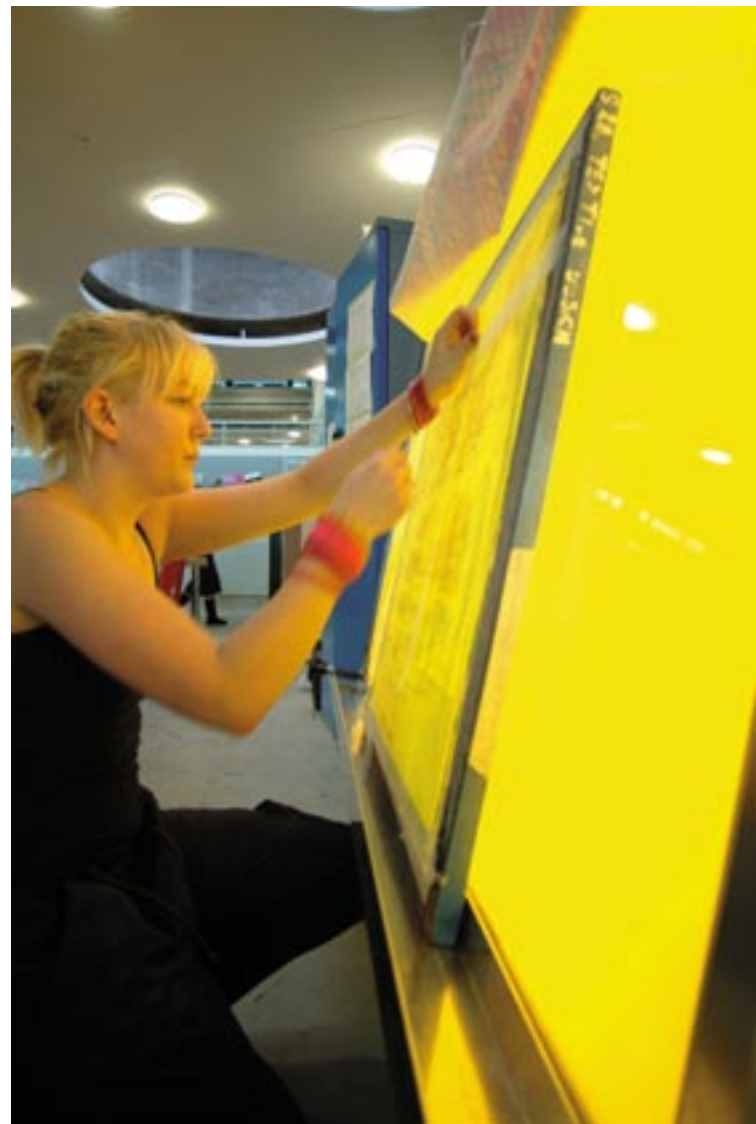
A textiltervezés a CUC egyik szakiránya