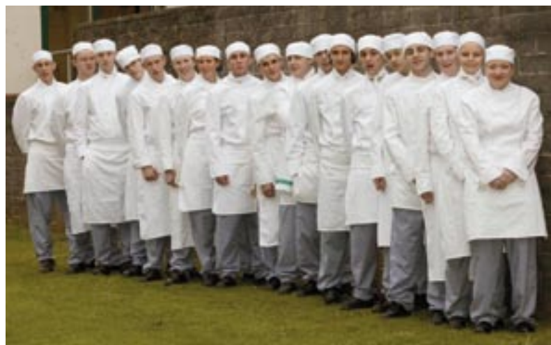
Fiatal szakácstanulók fényes jövő előtt

2005-ben Jamie Oliver meglátogatta a Watergate Bayt, és a helyszín kiváló benyomást tett rá. Ő nagyon lelkesen támogatta egy Fifteen vendéglő itteni megnyitását, de ezt a projekt állami támogatottságához kötötte. „A projekt kidolgozásához csak néhány hónapra volt szükség – magyarázza Carleen Kelemen, az »1. Célkitűzési Partnerség« igazgatója. – Partnereink, azaz az SWRDA, a Délnyugati Kormányzati Hivatal, a Jobcentre Plus és a köz- és magánszféra számos más szereplője azon voltak, hogy a hátrányos helyzetű cornwalli fiatalok ebből a lehetőségből a lehető legtöbb hasznot húzhassák. Az 1. célkitűzés 828 000 euró támogatást ítélt oda. A projektet 2005 augusztusában fogadták el, az étterem pedig 2006 májusában nyílt meg. Akárcsak az Extrém Sportok Akadémiája, ez is tökéletes sikernek bizonyult: 2006 májusa és decembere között a 40 új munkahelyet teremtő Fifteen Cornwall étterem 65 000