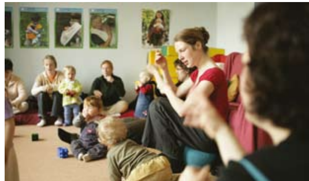
Egy leipzig-i bölcsődében (Németország).

A partnerségi megközelítés kulcsfontosságú szerepet játszik a nemek társadalmi dimenziójának beépítésében: összehoz olyan szervezeteket és egyéneket, akik jártasak a hasznos adatgyűjtésben, a helyi lakosság ismertetésében, jól megértik a nők és férfiak szükségleteit, valamint átlátják a lehetőségekhez való hozzáféréskor tapasztalható akadályokat. Az egyenlőség érvényesítésének „értelme” kell, hogy legyen a regionális fejlesztés szereplői számára. A projektvezetőknek szilárd adatokkal kell rendelkezniük annak érdekében, hogy bizonyítani tudják a nők és férfiak közötti egyenlőség érvényesítésének szükségességét, helytállóságát és az ebből eredő kézzelfogható előnyöket a szervezetek és projektek számára.