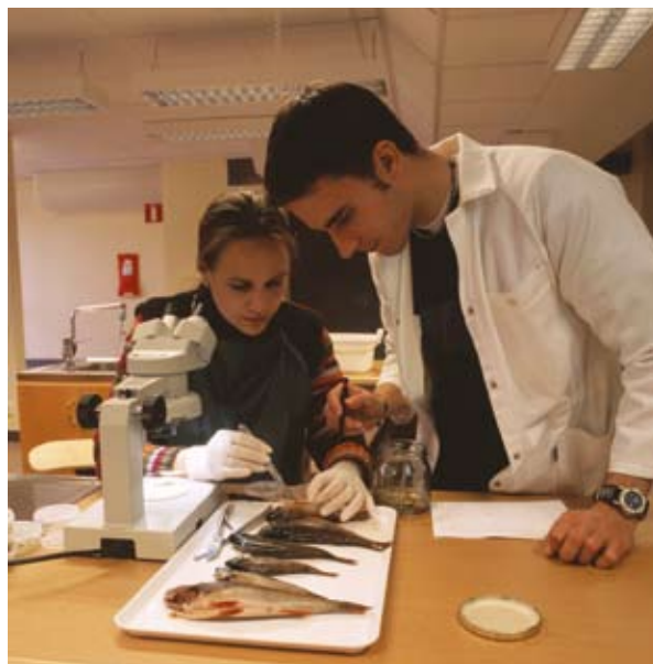
A halak táplálkozásának kutatása a svéd Lappföldön.

A férfi-női egyenlőség nemcsak az ESZA által finanszírozott projektek problematikája. A bevált gyakorlatok elterjesztéséből származó tapasztalataink azt mutatják, hogy az ERFA projektekben alapvető megértéssel viszonyulnak a független munkavállalók esélyegyenlőségét célzó törekvések iránt. Arra biztatjuk a projektindítókat, hogy vizsgálják meg projektjük életciklusát, és ennek fényében az eljárás minden szakaszában azonosítsák be a nemek társadalmi dimenziójának beépítési lehetőségeit: a tervezéstől és szakvélemény kérésétől kezdve a kiértékelésig és a közvetlen és közvetett megkülönböztetések megszüntetéséig. A projekthordozók felméri, hogy a nők és férfiak hasonlóan használják-e szolgáltatásaikat, valamint foglalkoznak a közvetett megkülönböztetés jelenségeivel. Ilyen lehet a gyermekfelügyeletet biztosító létesítmények megléte, vagy például a tömegközlekedési eszközök elérhetősége (a nők magánautóhoz való hozzáférése kisebb), csakúgy, mint a biztonság és a megvilágítás, a munkaidő, vagy a vállalkozási tevékenységet és vállalkozásindítást segítő szolgáltatások. A projektek hirdetésében sokat segíthet a nőket és férfiakat ábrázoló pozitív képek alkalmazása, amelyeket a nyitottságra és befogadásra utaló üzenetek egészítenek ki.