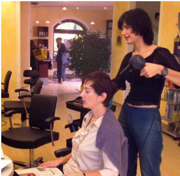
Az önálló vállalkozásba kezdő nőket támogató „Verein Frau und Arbeit” központ az ausztriai Salzburgban

A 2000–2006-os időszak nyilvánvalóvá tette, hogy szükség van ezekre a megközelítésekre. Bár több mint 13 000 projekt részesült támogatásban, csak részben sikerült kielégíteni az