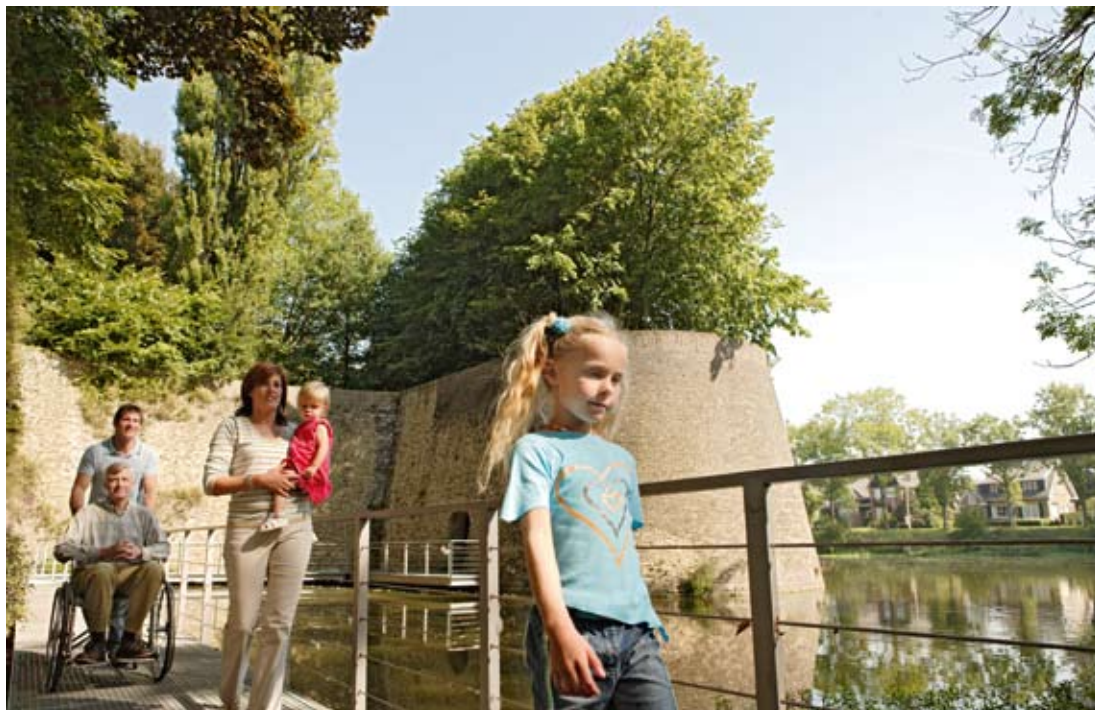
A mindenki számára hozzáférhető kulturális turizmus az „erődített városok hálózatának” egyik prioritása

Az egészségügy, a kultúra, a technológia, a környezetvédelem, az állampolgárság stb. terén százával működnek partnerségek. A kezdetektől (PACTE) az INTERREG IV-ig, a francia–belga határon átnyúló együttműködés mindvégig sikeresnek bizonyult.