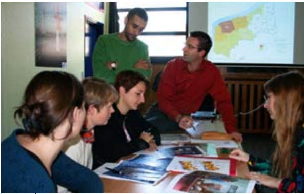
A „GoGIS” projekt célja egy határokon átnyúló földrajzi információs rendszer létrehozása

Az INTERREG IV sincs híján a projekteknek – a két múzeum kész új partnerekkel együtt dolgozni, nem is jelentéktelenekkel: jelenleg a Louvre-ral építenek kapcsolatot, amely 2008-ban Lens-ben nyit fiókintézményt, és az art brut -re (nyers művészet) szakosodott ghenti Dr. Guislain Múzeummal is tárgyalásokat folytatnak. Folyamatban van már a Navettes de l'Art projekt (buszközlekedés Ghent, Lille, Hornu, Lens stb. között), a Musées jardins projekt (családoknak szóló nyári események), a négy múzeum birtokában lévő dokumentumok közös gyűjteménybe való összevonása, továbbá egy volt vámházban kiállítás rendezése is.