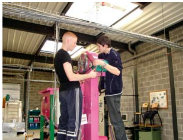
„Miniüzemek” elnevezésű határokon átnyúló képzési program

„Idővel, ahogy az INTERREG szakaszai egymást követték, konkrét betegségek (AIDS, veseelégtelenség stb.) kezelésére vonatkozó megállapodások kötésétől eljutottunk egy olyan struktúra kiépítéséig, amely lehetővé teszi a szervezett egészségügyi ellátáshoz való hozzáférést (pl. TRANSCARD, ZOAST-ok, sürgősségi egészségügyi szolgáltatások). A tervünk most az, hogy a régióban mindenkire kiterjedő, teljes körű, határon átnyúló egészségügyi ellátást hozunk létre. Hála az INTERREG-nek és az európai jognak, amely sokat tesz az ilyen megállapodásokért, ez egy teljes mértékben reális cél.”