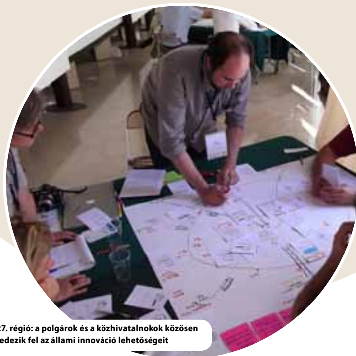
27. régió: a polgárok és a közhivatalnokok közösen fedezik fel az állami innováció lehetőségeit

Az állami intézményekben megvalósuló kreativitást, közös gondolkodást és társadalmi innovációt közösségi projektek, prototípuskészítés és tervezésorientált gondolkodás révén ösztönző 27. régió projekt azt szeretné elérni, hogy minden francia régió saját innovációs laborral rendelkezzen, amelynek segítségével szembe tud nézni a jelenlegi és jövőbeli kihívásokkal.