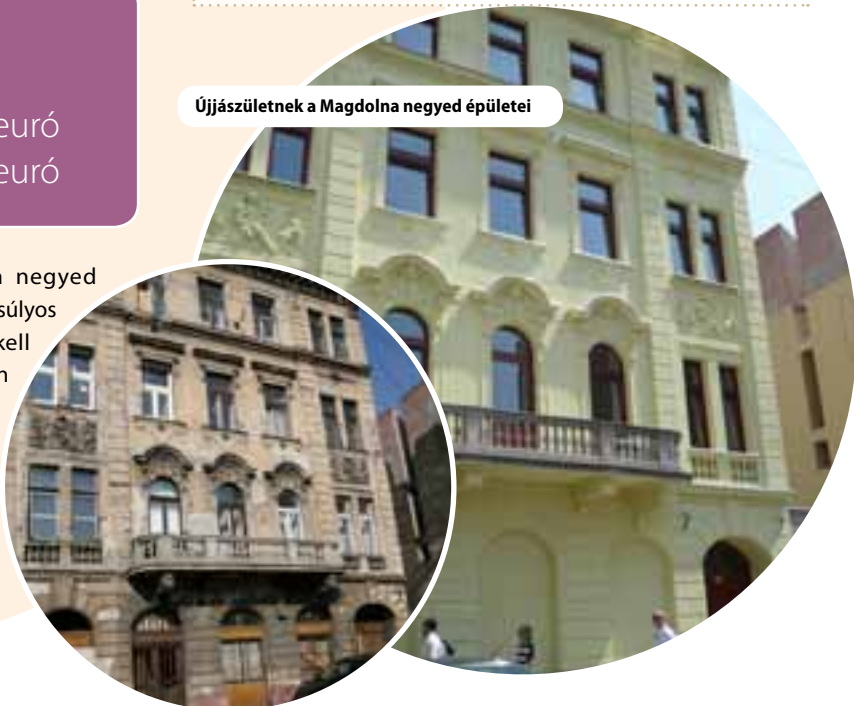
Újjászületnek a Magdolna negyed épületei