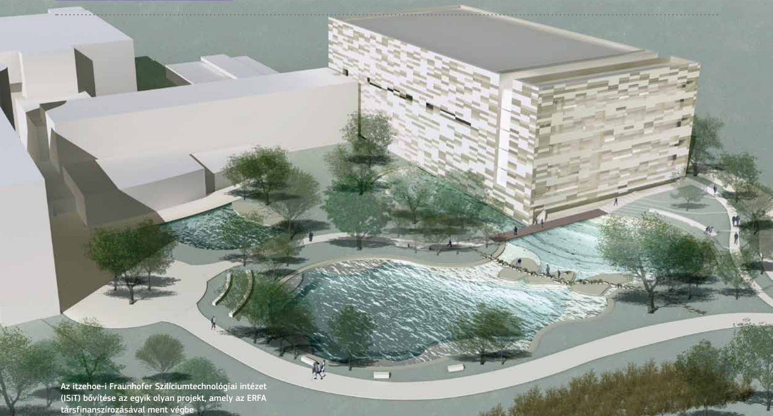
Az itzehoe-i Fraunhofer Szilíciumtechnológiai Intézet (ISiT) bővítése az egyik olyan projekt, amely az ERFA társfinanszírozásával ment végbe

létesítmény Németországban, ezért a jövőben is elismert ipari kutatási partner lesz, és új eljárásokat dolgozhat ki a mikrotechnológiában és a nanotechnológiában, és megerősítheti tekintélyét Európában és világviszonylatban is. Az itzehoe-i Fraunhofer Intézet által kutatott teljesítményelekttronikai és mikrorendszer-technológiai területek jelenleg erős fellendülést mutatnak.