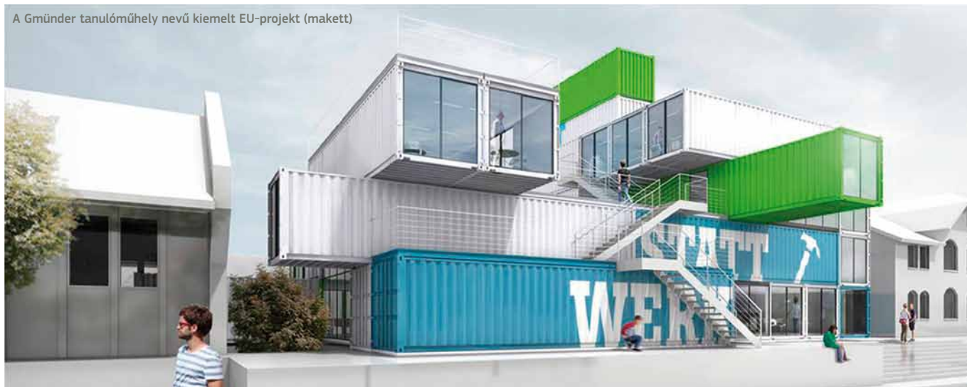
A Gmünder tanulóműhely nevű kiemelt EU-projekt (makett)

Az egyik ilyen modell részeként korábban intézetben ápolt fogyatékkal élőket segíti a munkaerőpiacra való belépésben. A Felső-Rajnavidéken található Heitershembben működik a Villa Artis, amely egy művészetterápiai akadémia és egy kávézót egyesít magában. Az akadémiaán a fogyatékkal élők sajátos művészi tehetségeit segítik a kibontakozásban. Az intézményben együtt dolgoznak a fogyatékkal és az a nélkül élők.