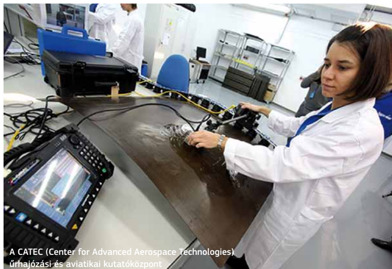
A CATEC (Center for Advanced Aerospace Technologies) űrhajózási és aviatikai kutatóközpont

Haladás mutatkozik a szociálpolitika területén is. Az egészségügyi szférában például 344 egészségügyi intézmény helyett mára összesen 1 597 áll rendelkezésre Andalúziában. A népesség végzettségi szintje is nőtt: 14,2 százalékkal több embernek van felsőfokú végzettsége, így az elmúlt 25 év alatt több mint egymillióra emelkedett azoknak a száma, akik felsőfokú oktatásban részesültek.