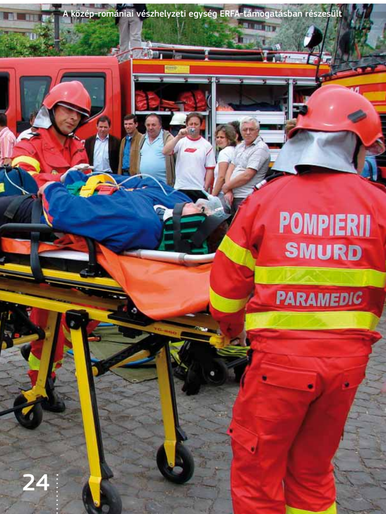
A közép-romániai vészhelyzeti egység ERFA-támogatásban részesült

AZ ELSŐ LÉPÉS: EGY MŰKÖDŐKÉPES PARTNERI KERETRENDSZER