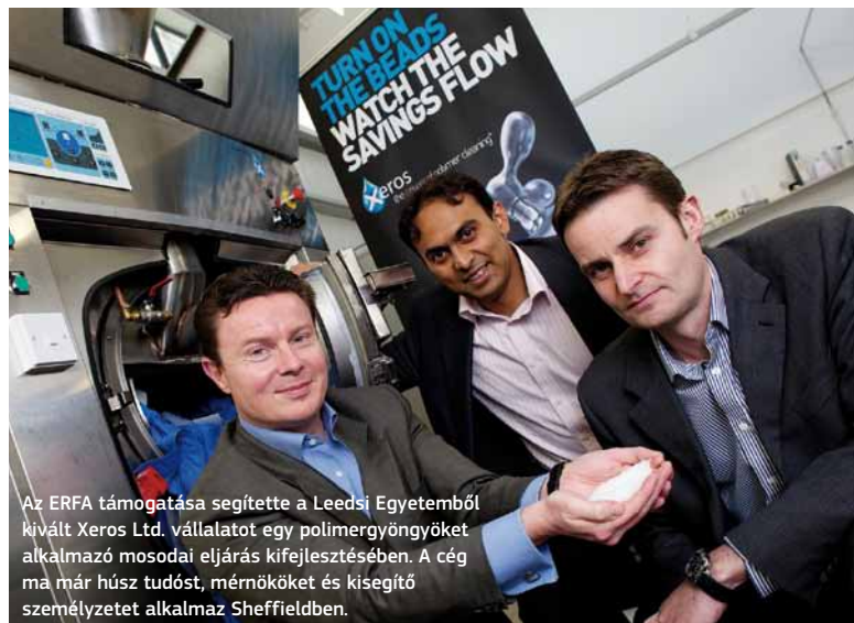
Az ERFA támogatása segítette a Leedsi Egyetemből kivált Xeros Ltd. vállalatot egy polimergyöngyök alkalmazó mosodai eljárás kifejlesztésében. A cég ma már húsz tudóst, mérnököket és kisegítő személyzetet alkalmaz Sheffieldben.

Ezenkívül tervezzük egy nemzeti szintű uniós növekedési program bevezetését is, amely az ERFA- és ESZA-források 100%-át, valamint az EMVA támogatásának egy részét a helyi partnerek által felvázolt stratégia alapján szétosztja a 39 HVP között. A központi kormány egyszerű ügyintézése lehetővé teszi a HVP-k és a helyi partnerek számára, hogy a 2014-2020 közötti időszakban maximálisan kihasználják a program nyújtotta rugalmasságot azáltal, hogy az egyes befektetési csomagokban összehangolja az ERFA-, ESZA- és EMVA-forrásokat az adott területre jutó finanszírozási keret alapján. A KSK-támogatásokat be fogjuk építeni az országos és a helyi szakpolitikákba, illetve ösztönző eszközökbe, hogy a gazdasági eredmények, illetve az állami/magánérdekek és -finanszírozások a leghatékonyabban felhasználhatók legyenek.