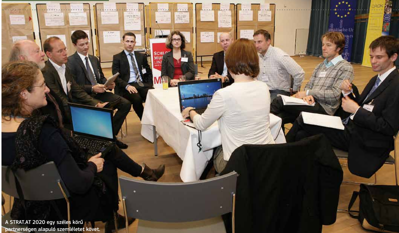
A STRAT.AT 2020 egy széles körű partnerségen alapuló szemléletet követ.

A STRAT.AT 2020 folyamat egy átfogó partnerségi megközelítést követ, és oly módon van felépítve, hogy az a stratégiai partnerek által közösen fejleszhető (és támogatható) legyen. A folyamat hivatalos elindítására az első nyilvános STRAT.AT 2020 fórumon került sor, amelyet 2012 áprilisában tartottak, 250 érdekelt fél részvételével. A fórumok nyitva állnak minden, a kohéziós politika és a vidékfejlesztési politikák iránt érdeklődő szereplő (a programok megvalósításában érdekelt partnerek, gazdasági és szociális partnerek, városi és helyi szintű tanácsok, közvetítő szolgáltatók, civil szervezetek, szakértők/akadémikusok stb.) előtt. A második fórumot az európai strukturális és befektetési alapok 11 tematikus célkitűzésének bemutatásának szentelték. A folyamat során a tervek szerint még további két fórumra kerül sor.