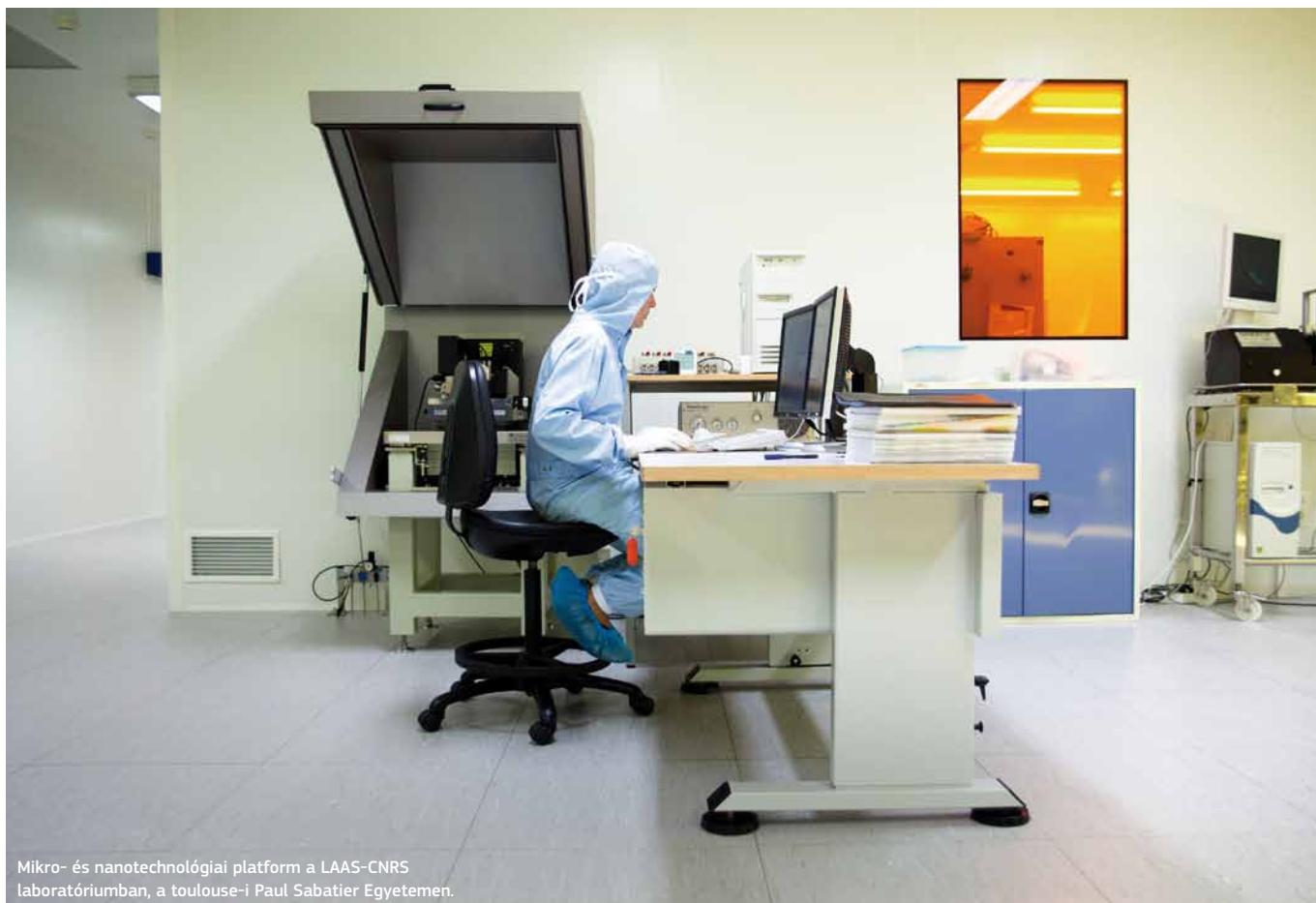
Mikro- és nanotechnológiai platform a LAAS-CNRS laboratóriumban, a toulouse-i Paul Sabatier Egyetemen.

Ennek az értékelő gyakorlatnak részeként Midi-Pyrénées a pireneusi–mediterrán eurorégió-beli partnerei felé (amely régióknak jelenleg az elnöke) egy „eurorégió szintű innovációs stratégia” megvalósításának javaslatával közelített. Ez egy olyan úttörő jellegű európai kezdeményezés lenne, amely