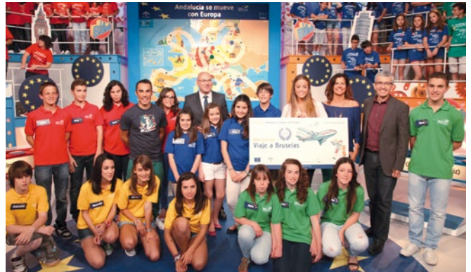
TV-vetélkedő Andalúziában Európáról.