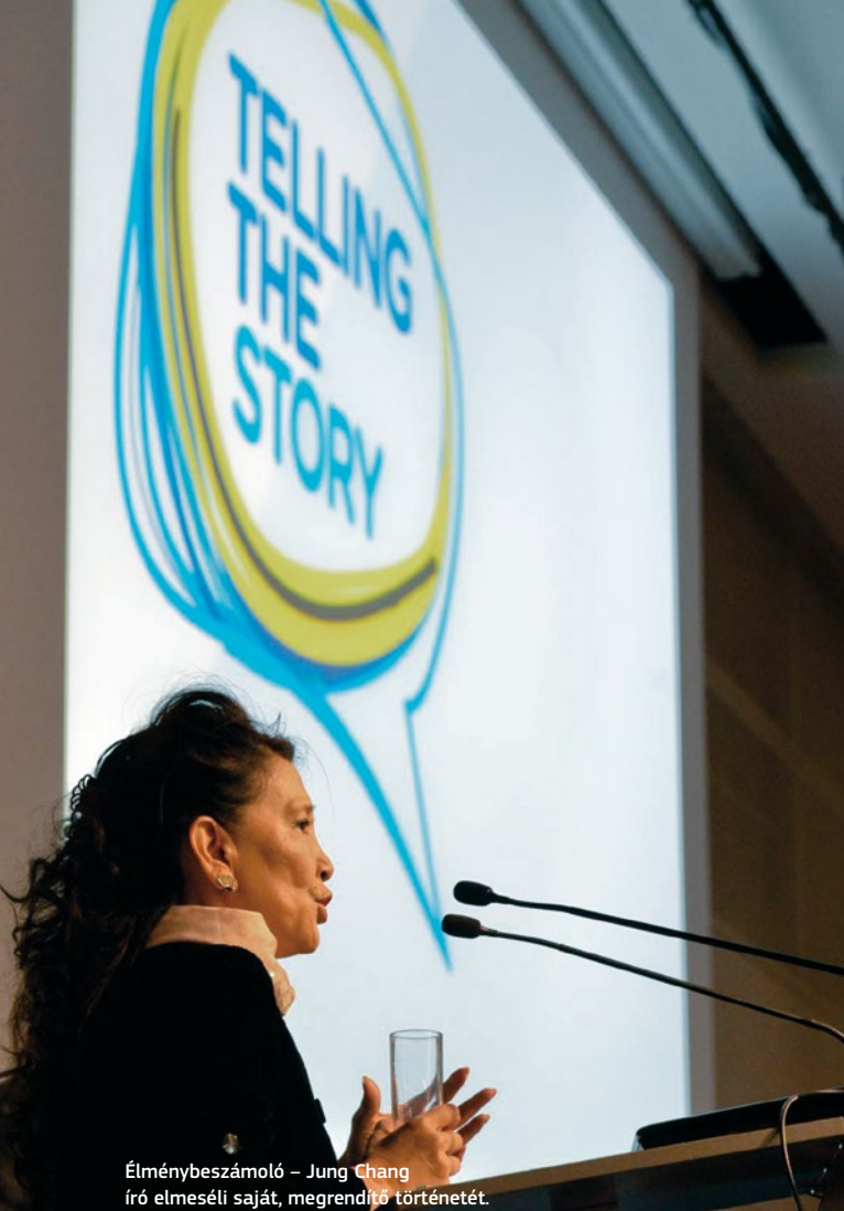
Élménybeszámoló – Jung Chang író elmeséli saját, megrendítő történetét.

A rendezvényen mind a 28 EU-tagországból összesen több mint 800-an vettek részt, és a konferencia hozzájárult az európai strukturális és befektetési alapok kommunikációjával foglalkozó EU-, nemzeti és regionális felelősök közötti együttműködés fokozásához, egyben megbízható kiindulási alapot is jelent a 2014 és 2020 közötti időszakban az európai strukturális és befektetési alapok programjait kísérő kommunikációs stratégiákhoz.