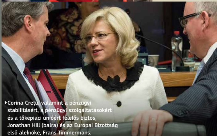
▶ Corina Crețu, valamint a pénzügyi stabilitásért, a pénzügyi szolgáltatásokért és a tőkepiaci unióért felelős biztos, Jonathan Hill (balra) és az Európai Bizottság első alelnöke, Frans Timmermans.