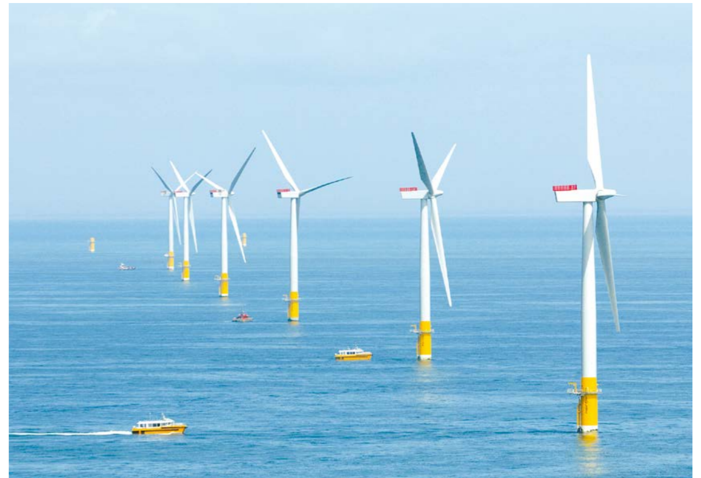
▶ Az egyesült királysági Greater Gabbard Offshore szélfarm 56 szélturbinával bővült a Galloper projekt részeként

Természetesen. Tudjuk, hogy a gazdaságaink dimenziójának jövője szempontjából elengedhetetlen, hogy támogassuk az európai kkv-kat, amelyek az új munkahelyek elsődleges forrásai. Az ESBA költségvetésének mintegy egynegyedét (azaz a 21 milliárd EUR-ból 5 milliárdot) ezért a kis- és középvállalkozások támogatására különítettünk el.