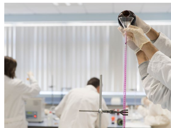
^ Az Alkalmazott Tudományok Intézete: a Máltai Művészeti, Tudományos és Műszaki Főiskola egyik új épülete.