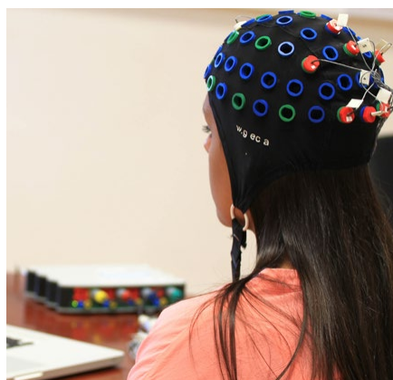
^ A Máltai Egyetem új orvosbiológiai mérnöki felszerelése, amely lehetővé teszi a tanulás praktikus és gyakorlatias megközelítését.