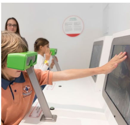
^ Gyerekek számára készült interaktív játékok, amelyek szórakoztatóvá teszik a tudományos ismeretszerzést.

https://eufunds.gov.mt/en/Information/Pages/EU-funds-for-Malta-2014-2020.aspx