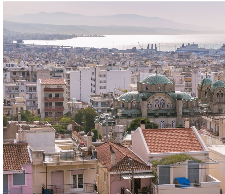
^ Pátra látképe.

Nyugat-Görögországban már érzékelhetők az uniós támogatás előnyei. Az Európai Regionális Fejlesztési Alap hozzájárult a 2008-as földrengés során megrongálódott pátrai Agios Andreas kórház újjáépítéséhez (lásd a projektről szóló írásunkat). A végéhez közeledik az a nagyszabású közúti infrastrukturális projekt, amely Pátrát köti össze Korinthosszal, és amely a régió gazdasági fejlődése szempontjából elengedhetetlen fontosságú. Emellett a Peloponnészoszi-félszigetet Görögország többi részével összekötő Rion-Antirion híd – a világ leghosszabb függesztett pályájú ferdekábeles hídja, amely egy mérnöki remekműnek számít – az ERFA támogatásával készült el. ■