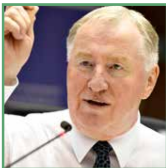
Karl-Heinz Lambertz, az Európai Régiók Bizottságának elnöke

A legnagyobb aggályom pedig a különböző alapok közötti kohézió gyengülése. A vidékfejlesztési eszköz többé már nem képezi a közös rendelkezésekről szóló rendelet részét, az Európai Szociális Alap pedig várhatóan az európai szemeszterrel fokozottan összehangolva működhet majd a jövőben. A kohéziós politika ereje sajnos meggyengült, ráadásul pont egy olyan az időszakban, amikor – az elmúlt 12 hónap konzultációi alapján – polgárok