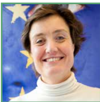
Jana Hainsworth, a Társadalmi Platform elnöke

A Társadalmi Platform szempontjából, a következő többéves pénzügyi keret (MFF) lehetőséget jelent az uniós költségvetés emberközpontú politikák felé billentésére. A társadalmi kohézióra és az integrációs politikára irányuló beruházás az ellenállóbb gazdaságok, a biztonságosabb társadalmak és az EU-szerte emelkedő konvergencia alapfeltétele.