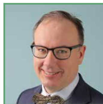
Magnus Berntsson, az Európai Régiók Gyűlésének elnöke

A tervezett, kohéziós politikát érintő megszorítások az Európán belüli gazdasági, társadalmi és területi kohézió ösztönzését célzó költségvetés megerősítésére irányuló kötelezettségvállalás hiányát jelzik. A kohéziós politika az a szakpolitika, amelynek eredményei Európa valamennyi régiójában tapasztalhatóak. Aggodalomra ad okot a kohéziós politika centralizációjára irányuló törekvés és a szakpolitika strukturális reformokra történő – régiók részvétele nélküli – felhasználása. A politika sikere valójában éppen abban rejlik, hogy közel áll a helyi és regionális szinthez, illetve az európai polgárokhoz.