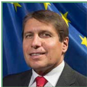
Markus J. Beyrer, a BusinessEurope főigazgatója

A vállalkozások úgy vélik, hogy a 2020 utáni uniós költségvetésnek tükröznie kell a jövőbeni prioritásait, és a versenyképességünk ösztönzésére irányuló erőfeszítésekre kell összpontosítania, különösen azokon a területeken, ahol az EU konkrét eredményeket érhet el és elősegítheti az ágazat felkészítését a digitalizációhoz vagy energiaátálláshoz hasonló megatrendekre.