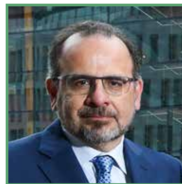
Luc Jahier, az Európai Gazdasági és Szociális Bizottság elnöke

Továbbra is fenntartásaim vannak a kohéziós politikát (és a közös agrárpolitikát) érintő, Bizottság által javasolt megszorításokkal kapcsolatban.