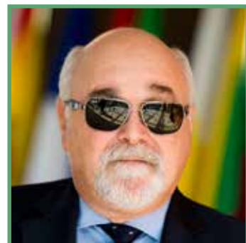
Yannis Vardakastanis, az Európai Fogyatékosügyi Fórum elnöke

A 2020 utáni időszakra vonatkozó javaslat azonban aggasztó. A tervezett költségvetési csökkentés a leginkább kiszolgáltatottabb helyzetben lévő európaiakat érinti majd, különösen a legveszélyeztetettebb régiókban. Az Európa-ellenes hangulattal terhelt légkörben a megcsonkított költségvetés csak olaj lesz a tűzre. Ráadásul Európa kettészakadásának kockázatát is erősíti – növeli a szakadékat a virágzó régiók és a társadalmi szempontból kirekesztett, az európai projekttől távolodó régiók között.