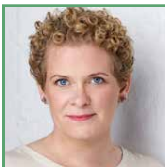
Karin Wanngård, Stockholm polgármestere

Stockholm polgármestereként úgy vélem, hogy a polgárok és az EU közötti kapcsolat legláthatóbb megnyilvánulásai az uniós finanszírozású projektek. Az ESZA és az ERFA alapjai a beruházásokra vonatkozó döntéseket közelebb hozták a polgárokhoz, városokat és régiókat EU-szerte támogatva a sürgető kihívások kezelésében és a kiaknázatlan lehetőségek gyakorlati megragadásában. És ez csak az egyik oka annak, amiért sajnálattal vettem tudomásul a kohéziós politika teljes költségvetésének csökkentésére irányuló javaslatot.