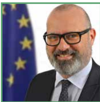
Stefano Bonacini, az Emilia-Romagna régió és az Európai Települések és Régiók Tanácsának elnöke

Az Európai Bizottság javaslata egy jó irányú lépést jelent, jóllehet nem biztosít valódi integrált megközelítést az érintett alapok tekintetében.