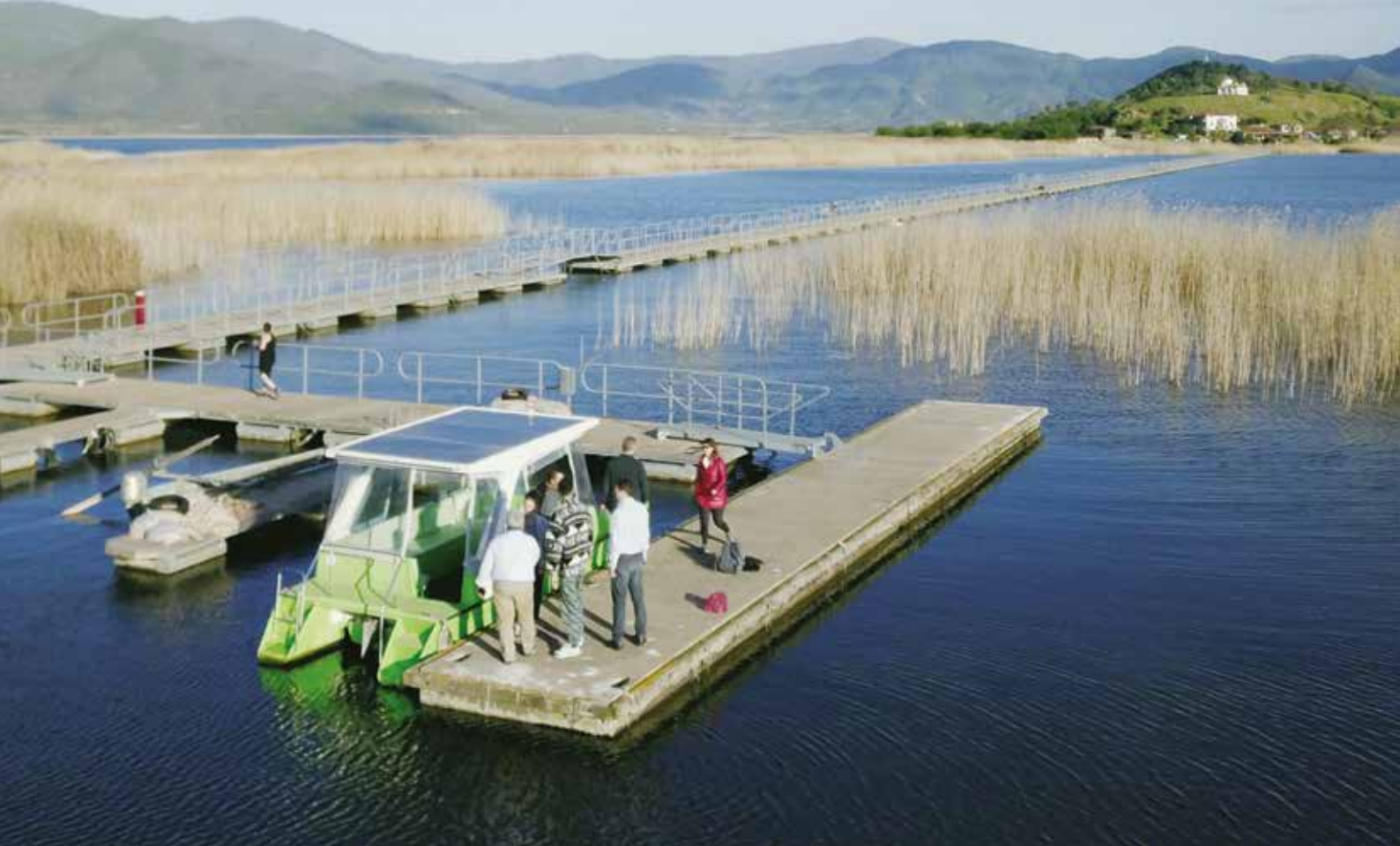
Egy egyedi, napenergiával működő „zöld hajó” vitte az utazókat egy Görögország és Albánia között található titkos szigetre