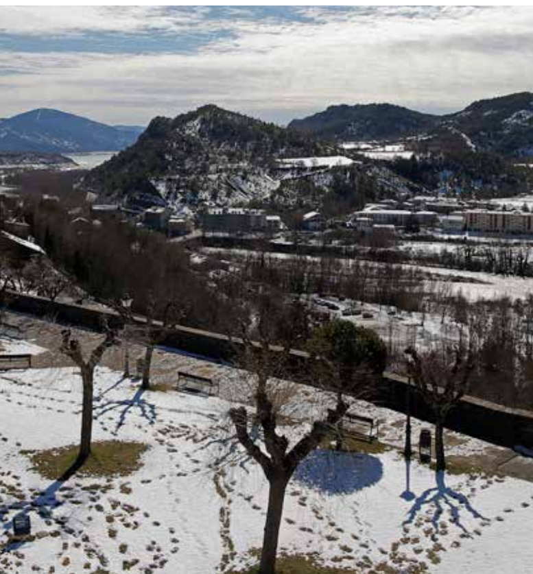
Ainsa a spanyol Pireneusok lábánál Aragóniában

A TAIEX-REGIO PEER 2 PEER az ERFA és KA kezelésében részt vevő közigazgatások – többek között irányító hatóságok, közreműködő szervezetek, ellenőrző, igazoló és koordináló hatóságok, valamint az európai területi együttműködés közös titkárságai – számára érhető el.