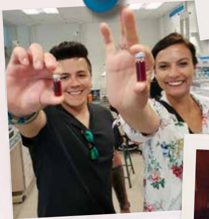
Vinovert: borkóstolás a franciaországi Bordeaux-ban