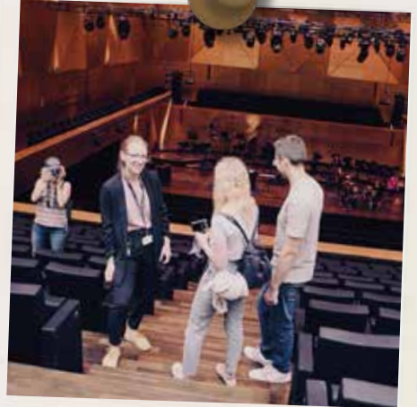
Az új koncertterem Szczecinben (Lengyelország)