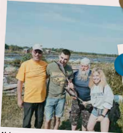
Akár az igazi finn halászkok, Tornio, Finnország