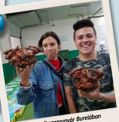
Kézműves halkonzervgyár Burelában (Spanyolország)