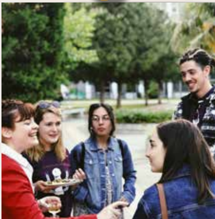
PlantCult, Szaloniki, Görögország