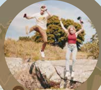
Achilleas és Luna