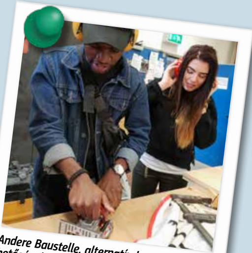
Andere Baustelle, alternatív karrierlehetőségek a németországi Ulmban