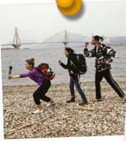
Rio-Antirrio-híd, Korinthoszi-öböl, Görögország