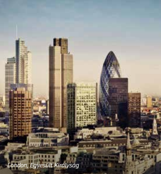
London, Egyesült Királyság