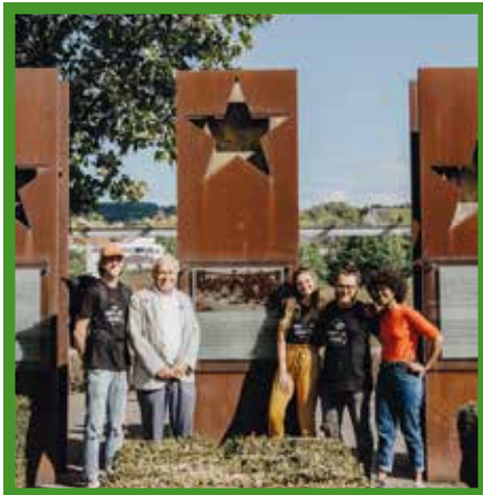
Csoportkép Luxemburgban Charles Elsennel, a Schengeni Megállapodás egyik aláírójával