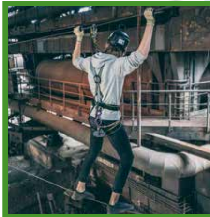
A csúcspont elérése Németországban a duisburgi Landschaftsparkról készítendő légi felvételhez