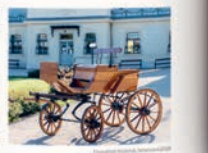
Kápolnásnyék kastélya, Halászlé