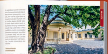
Velencei-tó, Kápolnásnyék kastélya

Érdekes hírek A Velencei-tó egyik legismertebb látványterve a Kápolnásnyék kastélya. A kastély a 18. században épült, és a ma is a Velencei-tó egyik legismertebb látványterve. A kastély a 18. században épült, és a ma is a Velencei-tó egyik legismertebb látványterve.