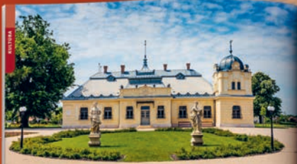
Velencei-tó, Kápolnásnyék kastélya

AHOL A MŰLT, A JELEN ÉS A JÖVŐ ÖSSZEÉR KÁPOLNÁSNYÉK, HALÁSZ-KASTÉLY A halászlé nemcsak a Velencei-tó egyik legismertebb ételje, hanem a Kápolnásnyék kastélya egyik legismertebb látványterve is. A kastély a 18. században épült, és a ma is a Velencei-tó egyik legismertebb látványterve. A kastély a 18. században épült, és a ma is a Velencei-tó egyik legismertebb látványterve.