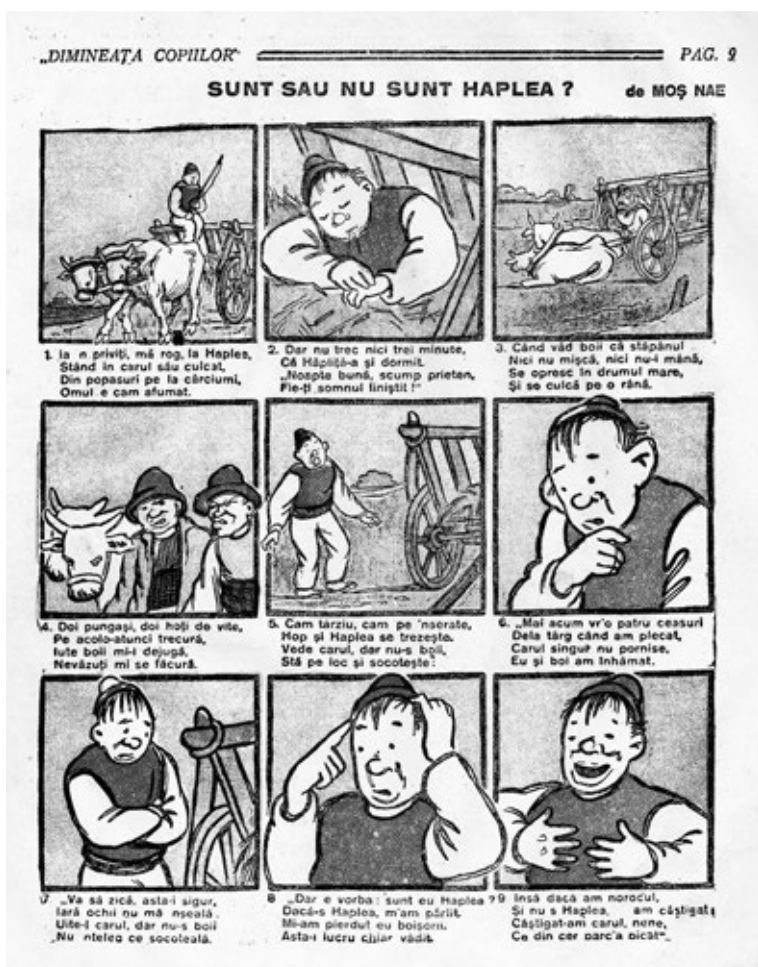
1. ábra – Haplea a Dimineața Copiilor című gyereklap második számában

zetben való szerepeltetése miatt vált népszerűvé. A történetek címeiben is kiemelt szerepet kapott a karakter neve: Vaca lui Haplea [Haplea tehene], Ochelarii lui Haplea [Haplea szemüvege], Haplea nu e Haplea [Haplea nem Haplea]. A címekhez híven néhány rímbe szedett sor kísérte a képeket.