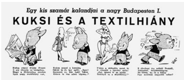
2. ábra – Egy kis számár kalandjai a nagy Budapesten

Érdekes módon egy antropomorfizált figura az, aki Hapleához hasonlóan komikusan oldja meg a társadalmi helyzeteket. Az 1945-ben megjelent Ludas Matyi vicclapban találkozhatunk Kuksival, a számmárral, akinek történetei Egy kis számár kalandjai a nagy Budapesten sorozatcímen futottak (2. ábra). Kuksi karaktere több szempontból is Hapleához hasonló módon van ábrázolva. A különböző történetek itt is önálló címeket kaptak, melyekben szintén dominál a szereplő neve: Kuksi és a textilhiány , Kuksi és a drágaság , Kuksi lapengedélyt kér . A formai világot illetően a képeket itt is rímekbe szedett szövegek egészítik ki. A jellem- és a helyzetkomikum egyaránt érzékelhető mindkét karakternél, és ez elsődlegesen a közéleti és a mindennapi helyzetek banalitásában csúcsosodik ki.