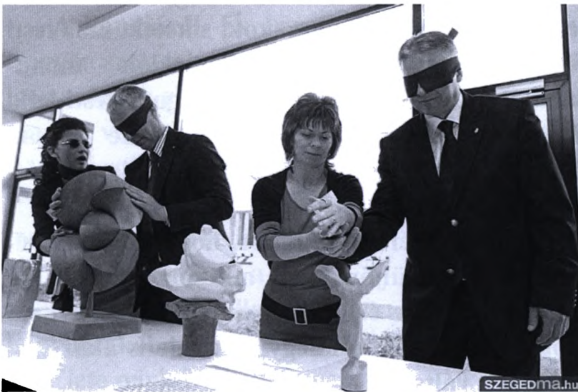
A tapintható tárlat megnyitója

A kiállítás egy hétig volt látható, ahol lelkes önkéntes gimnazisták siettek a kíváncsiskodók segítségére.