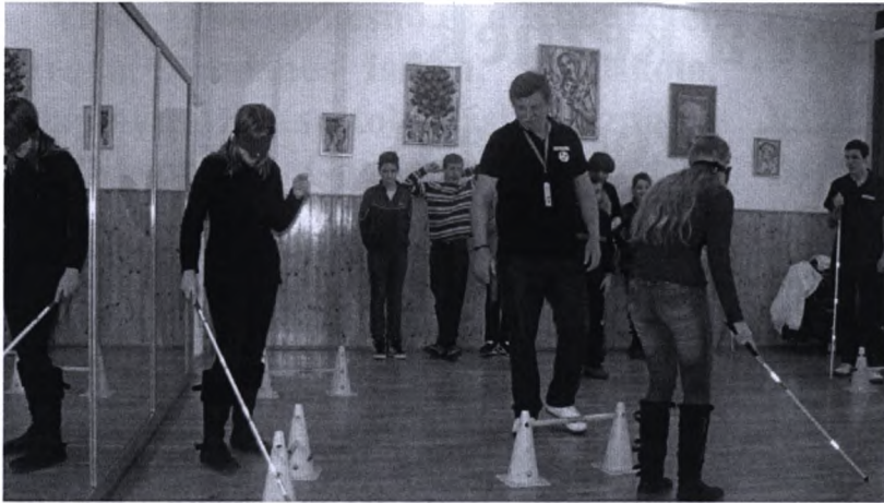
Férbotos közlekedés letakart szemmel

tásfogyatékoság állapotát, az érintettek életkörülményeit, kommunikációjuk speciális módjait és eszközeit. Megmutatjuk tudásukat, elért eredményeiket, önálló életviteli lehetőségeiket. Ugyanakkor felhívjuk a figyelmet a szükséges és elvárható segítségnyújtási formákra, viselkedési módokra is.