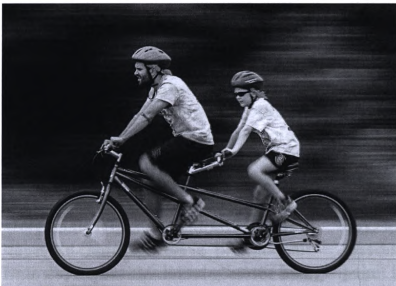
Együtt gyorsabb - látó és látássérült párosa

Meglátjátok, izgalmas lesz, mondja valaki a Hold utcai Hotel President Budapest előterében, de persze mi pontosan tudjuk, hogy nem látjuk meg, hiszen láthatatlan vacsorára gyülekezünk. Arra teszünk kísérletet, hogy vak, illetve látássérült emberek segítségével elfogyasszunk egy menüsört a szálloda egyik teljesen elsötétített termében.