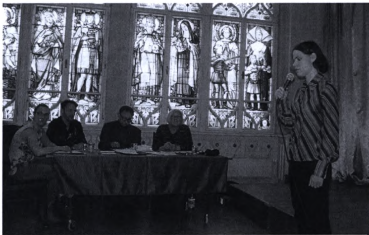
A szavalóverseny egyik résztvevője a zsűri előtt

1997 óta veszek részt a szavalóverseny megszervezésében, mondta el köszöntőjében Bereczkné Bihari Erzsébet. Minden alkalommal "Tükörben a vers tükörben a költő" címmel tartják a rendezvényt, ezért a versenyzőknek a szabadon választott költők versein túl, adott évben mindig mástól kell egy-egy költeményt kiválasztani. Idén Weöres Sándorról és Határ Győzőről emlékezett meg az a 10 lelkes versmondó, aki április 12-én színpadra állt a Nádor teremben. Komoly díjakért zajlott a küzdelem, mivel a versenyt a Nemzeti Kulturális Alap (NKA) támogatásával szervezték meg.