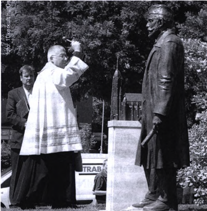
Attila atya megszentelte a szobrot

- Amikor megszentelünk egy szobrot, gondolunk azokra, akik megalkották, de ugyanakkor a teremtő Isten felé is odafordulunk. Hiszen minden kétkezi munkánk mögött a teremtő Isten szándéka, akarata és az ő megszentelő ereje áll - mondta, és a továbbiakban Szent Pál ide vonatkozó leveléből idézett.