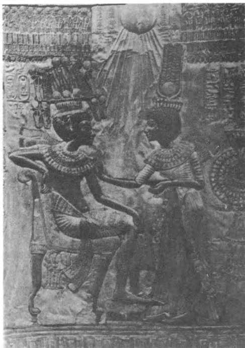
Tutanhamon fáraó és felesége

November 5-én kilenc órakor kezdődött a tanácskozás. Délelőtt a Siket-Vakokkal Foglalkozó Bizottság beszámolóját hallgattuk meg. A bizottság felmérései alapján szomorúan állapítható meg, hogy a legtöbb országban növekszik a halmozottan sérültek, így