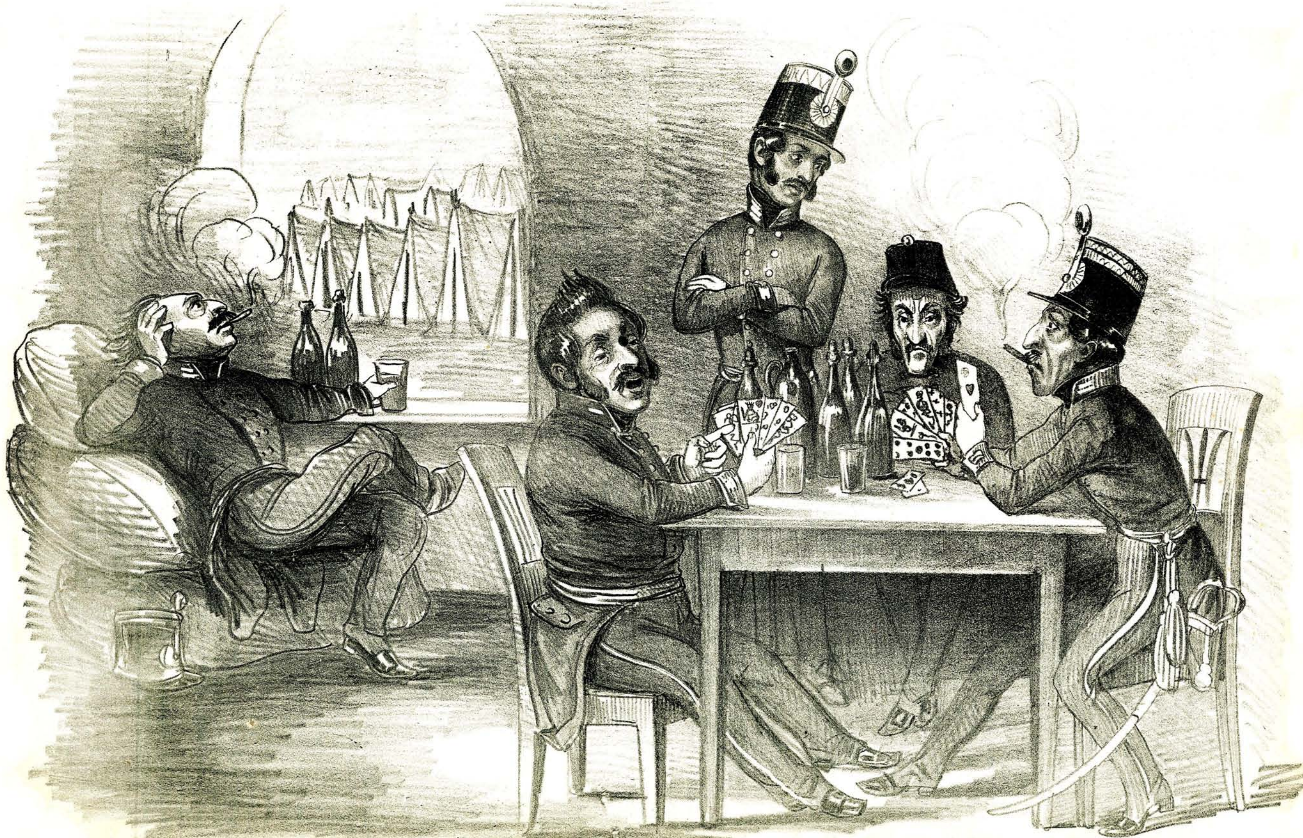
Lemegyünk két hétre kártyázunk, és iszunk, haza jövén pedig, szinte neki dühödünk a nagy dicsőségtől.