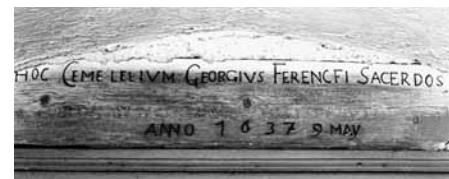
A gyergyószentmiklósi örmény templom kiskapujának szemöldökfája