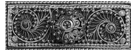
Öv részlet, Budapesti Örmény Katolikus Lelkészség, 19. sz.

Csak meghívottak részére! A kiállítás április 6-tól szeptember 15-ig látogatható.