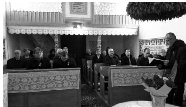
A Barankovics Alapítvány és a Báthory-Bem Hagyományörző Egyesület megemlékezése