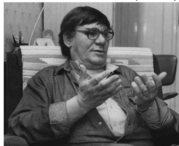
Lászlóffy Aladár

Egyetemista koromban figyeltem fel a kolozsvári irodalmi lapokban megjelent verseire, majd vettem a bátorságot, és levelet írtam neki. Ezzel vette kezdetét a szakmai kapcsolatunk, amely aztán a haláláig kitartott. Voltaképpen mindig is követtem ezt a páratlan életművet, Lászlóffyról több tucat tanulmányt és két könyvet is írtam, az egyik egy monográfia volt. Amikor 1998-ban Kossuth-díjas költőként a Digitális Irodalmi