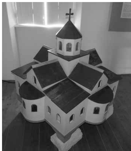
Az 1000 éves örmény templom makettje